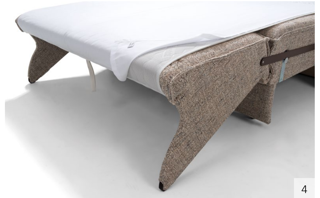
CORA | 1. Kopfhochsteller | 2. riesiger Stauraum | 3. automatischer Matratzenschoner mit optionalem Leintuch | 4. abnehmbares Leintuch, bis 60°C waschbar