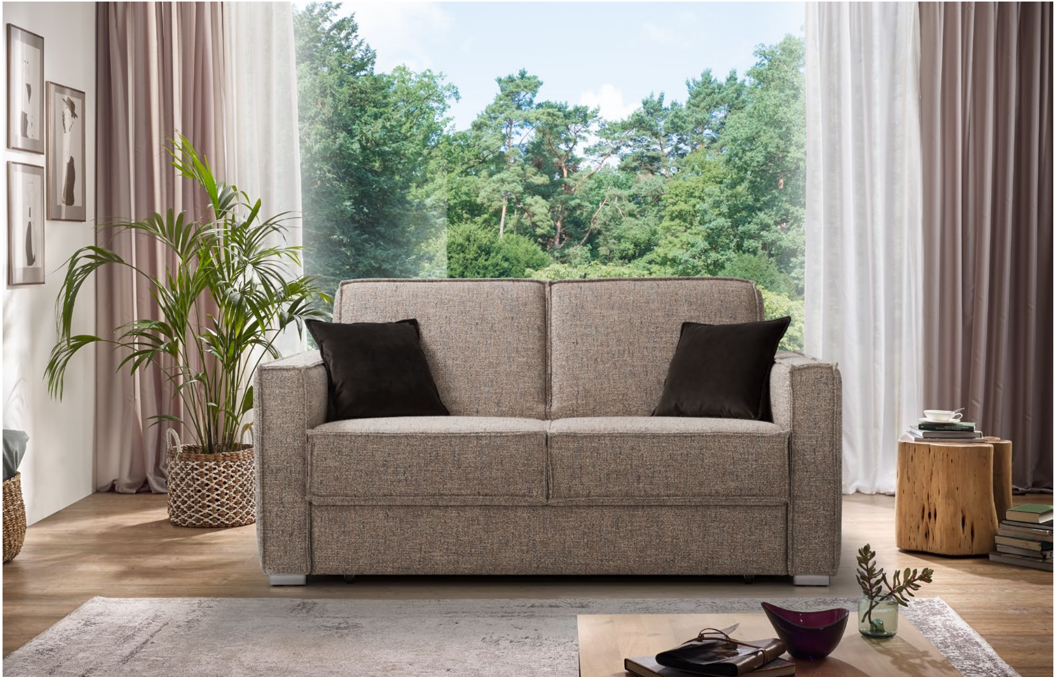
CORA | D130, AT15-B | Fuss Nr 62 Alu matt