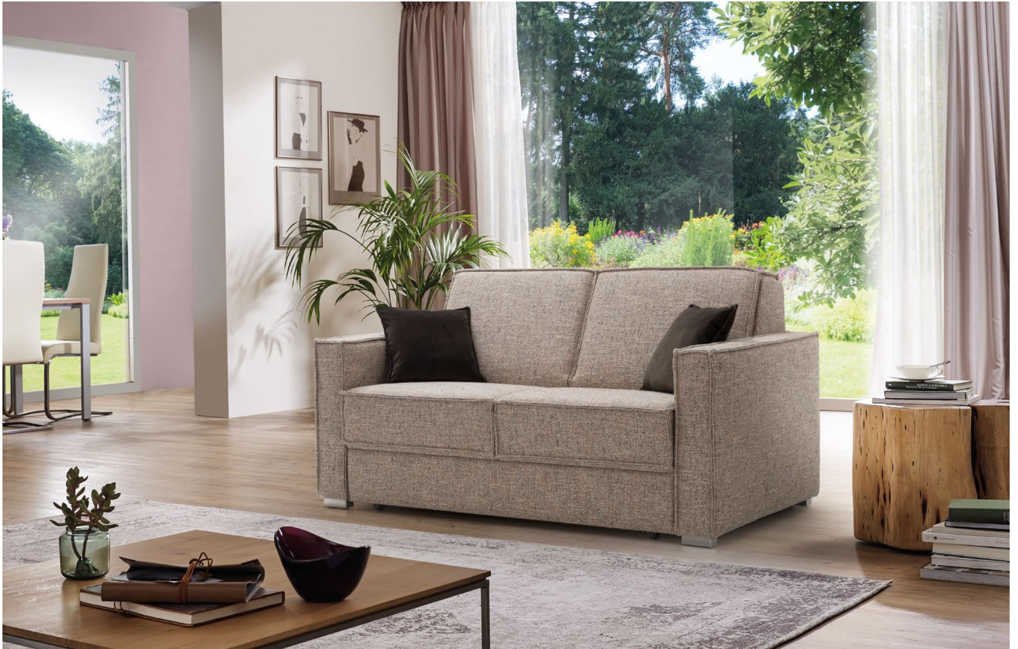
CORA | D130, AT15-B | Fuss Nr 62 Alu matt