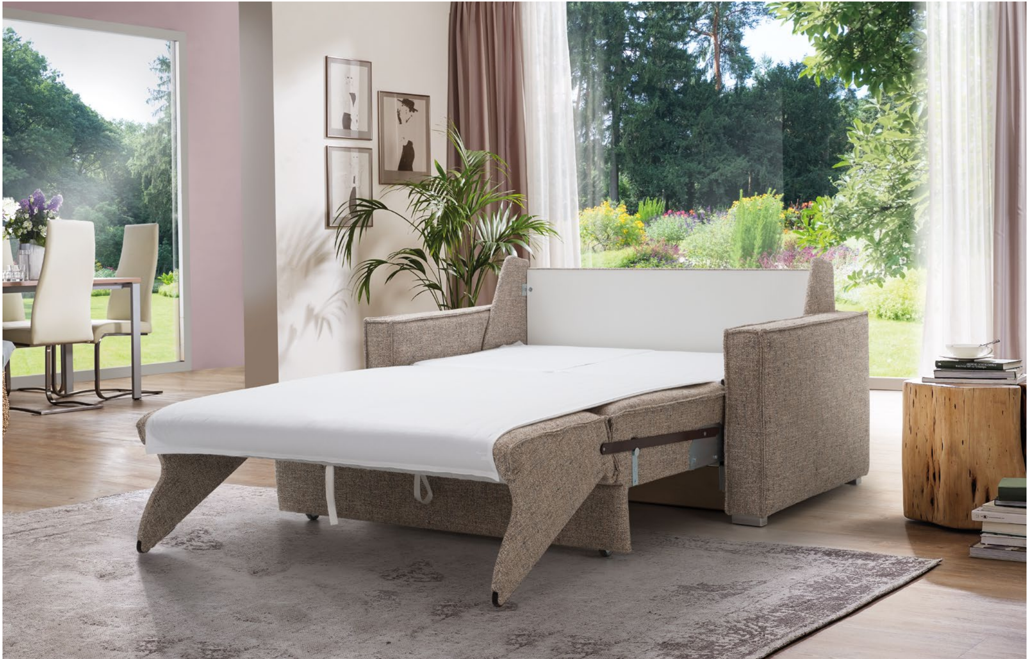
CORA | easy Längsschläfer Bettfunktion mit automatischem Matratzenschoner und abnehmbarem Leintuch | Liegefläche ca 130 x 200 cm