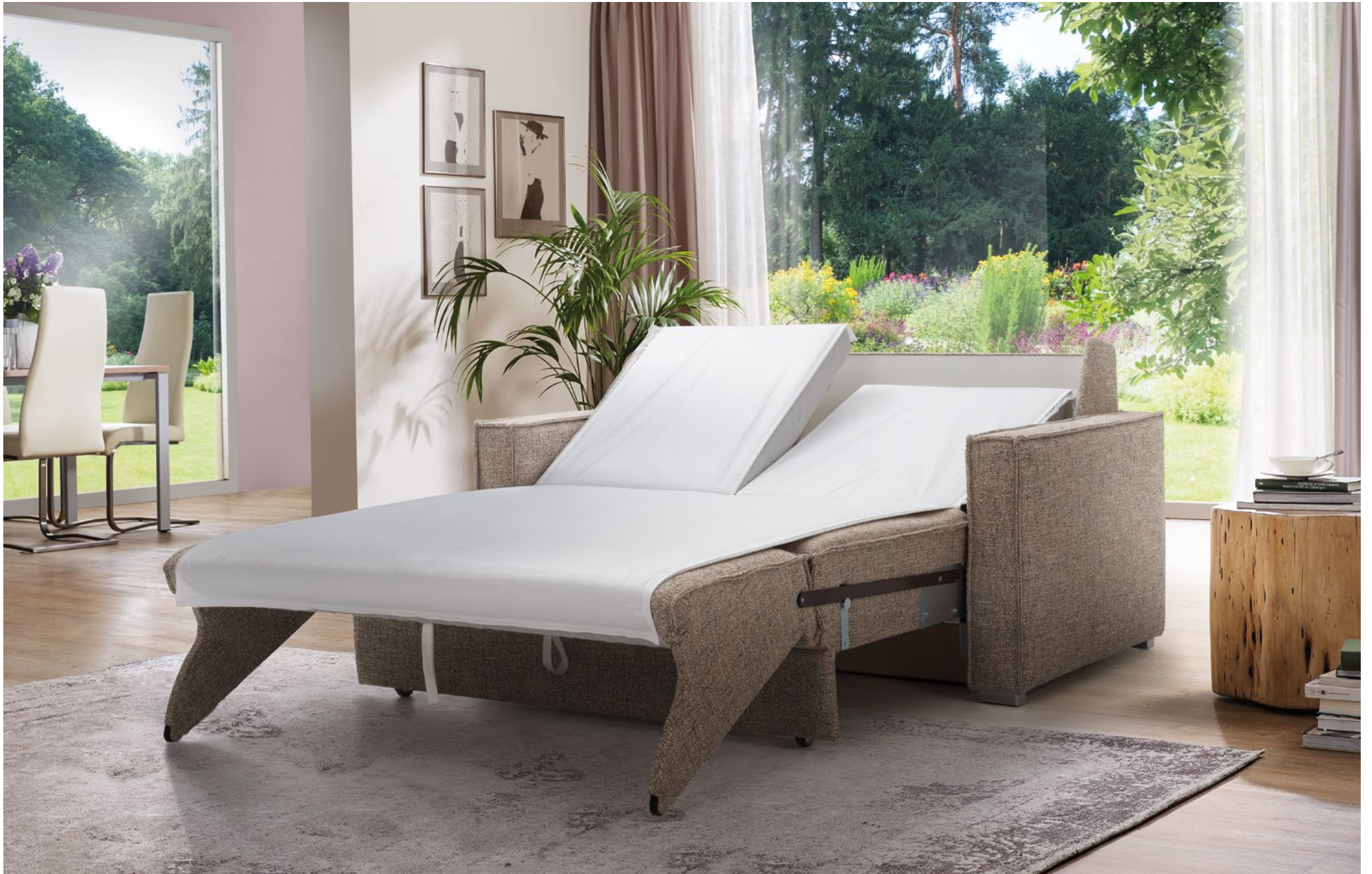
CORA | easy Längsschläfer Bettfunktion mit Kopfhochsteller | Liegefläche ca 130 x 200 cm