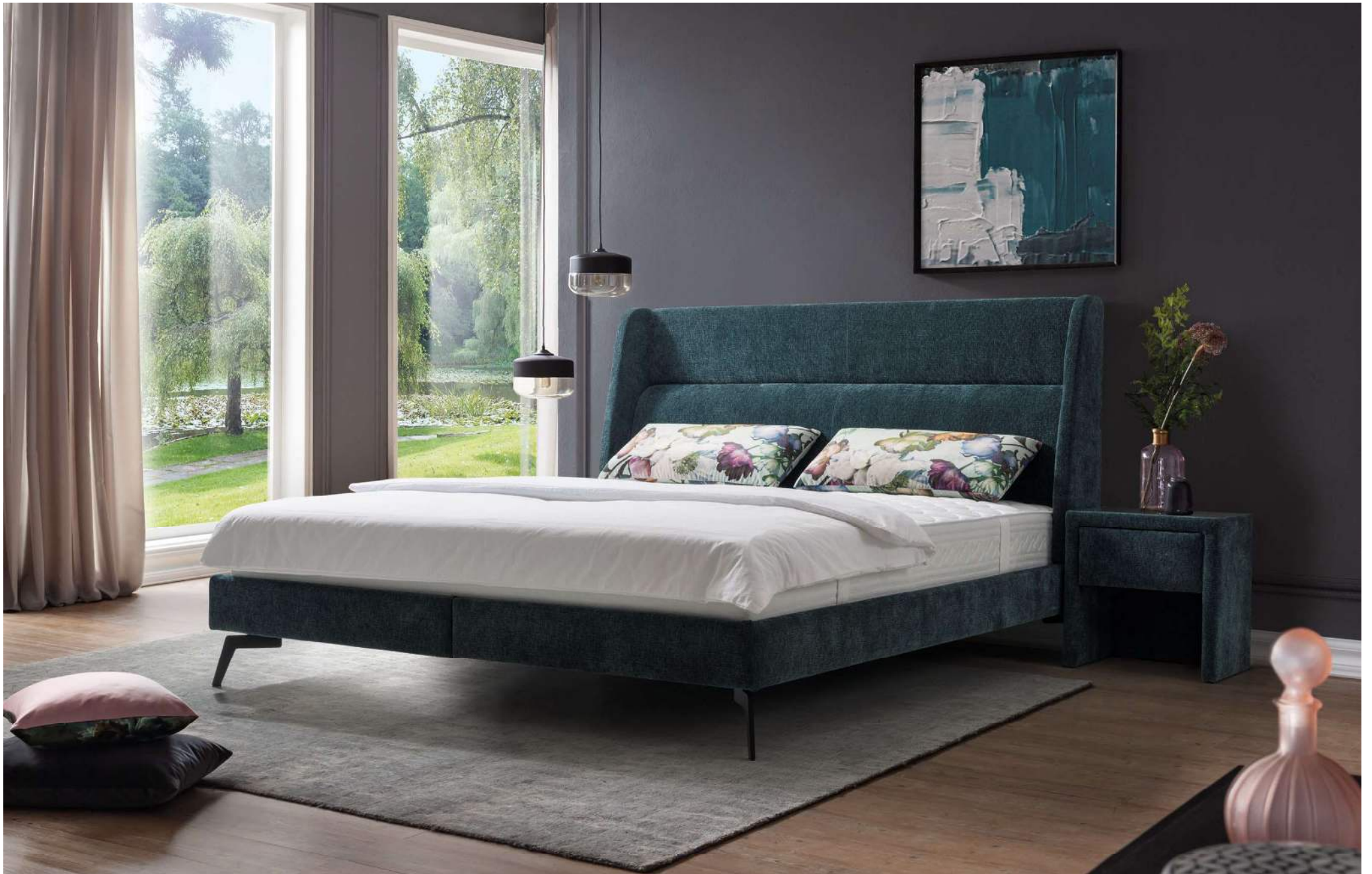
BIRDY | Polsterbett mit Nackenstütze im Kopfhaupt | Liegefläche 180 x 200 cm | Außenmaß 192 x 225 cm | Nachtkästchen siehe Zubehör