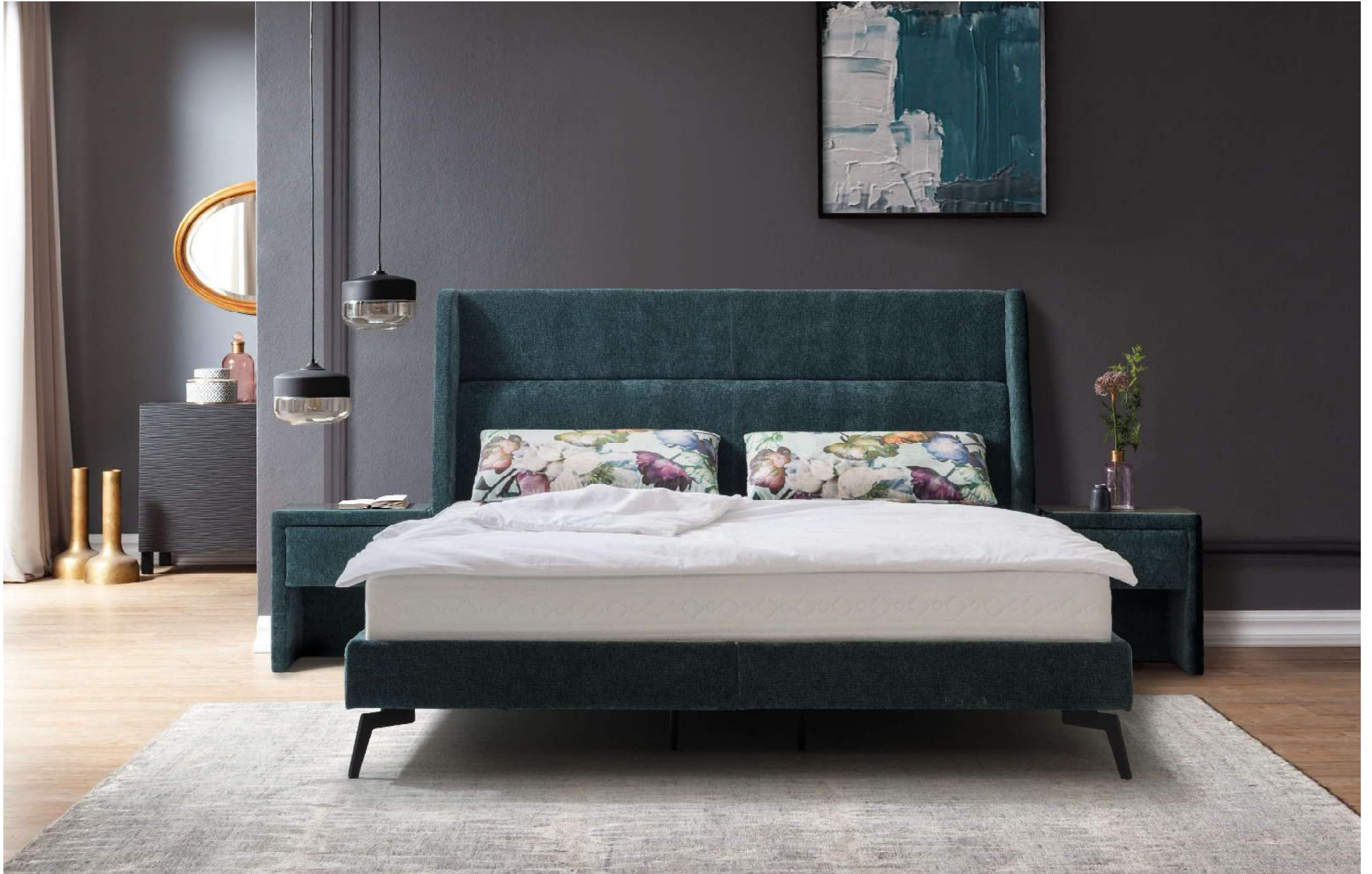
BIRDY | Polsterbett mit Nackenstütze im Kopfhaupt | Liegefläche 180 x 200 cm | Außenmaß 192 x 225 cm | Fuß Nr 29 schwarz matt