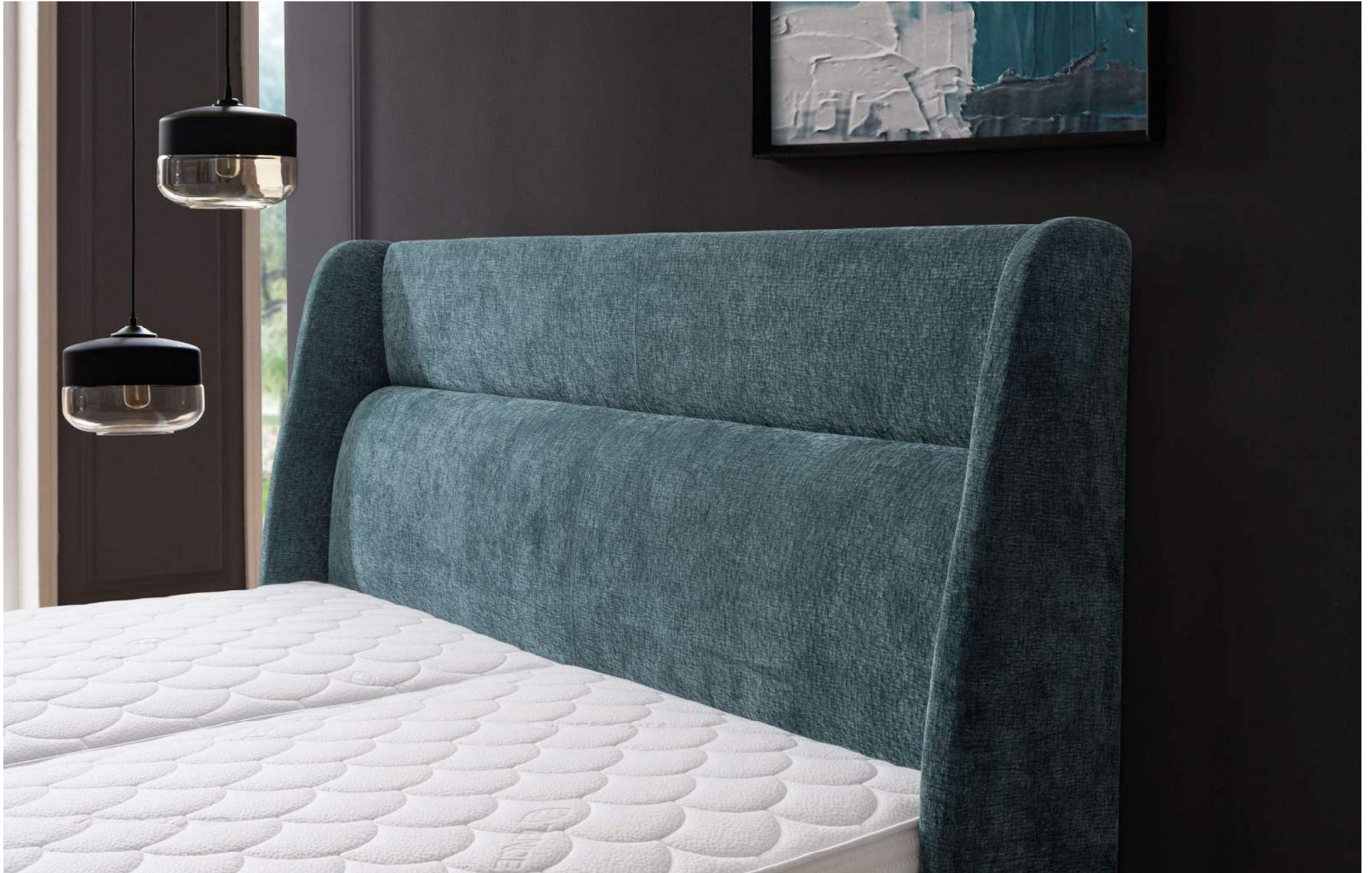
BIRDY | Nackenstütze im Kopfhaupt