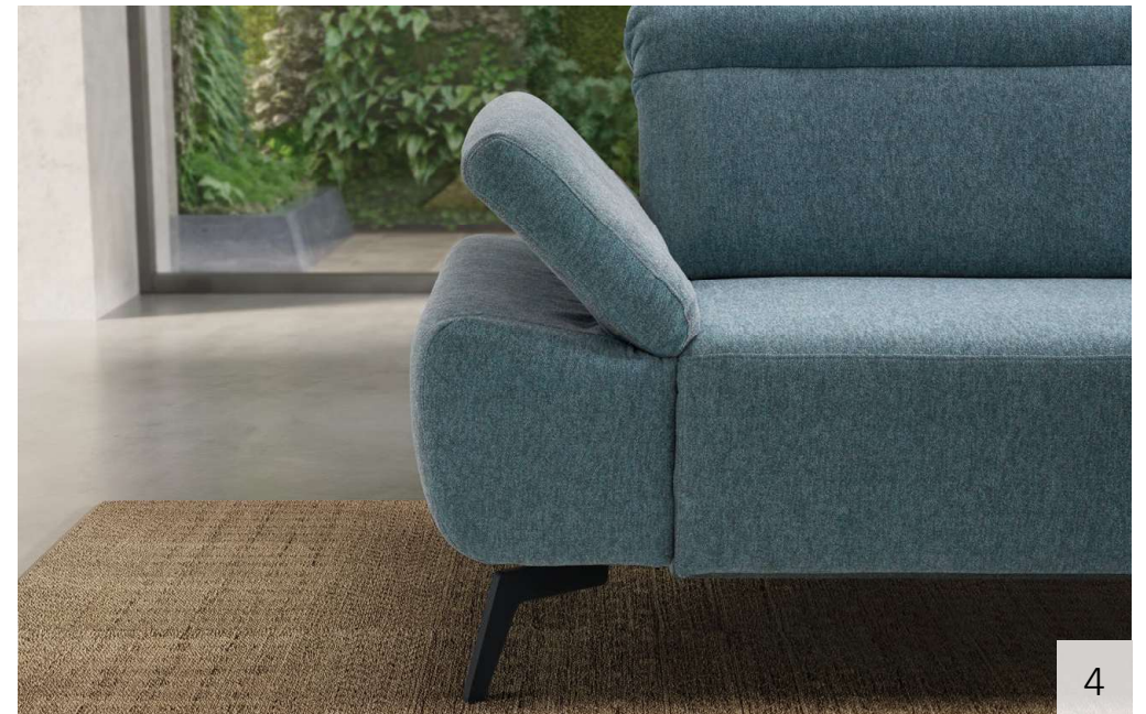
DARIA | 1. elektrische Schlafbank | 2. Infrarot Tiefenwärme (elektrosmogfrei) | 3. Funktionskopfstütze | 4. Armteil 33 cm, klappbar (AT20)