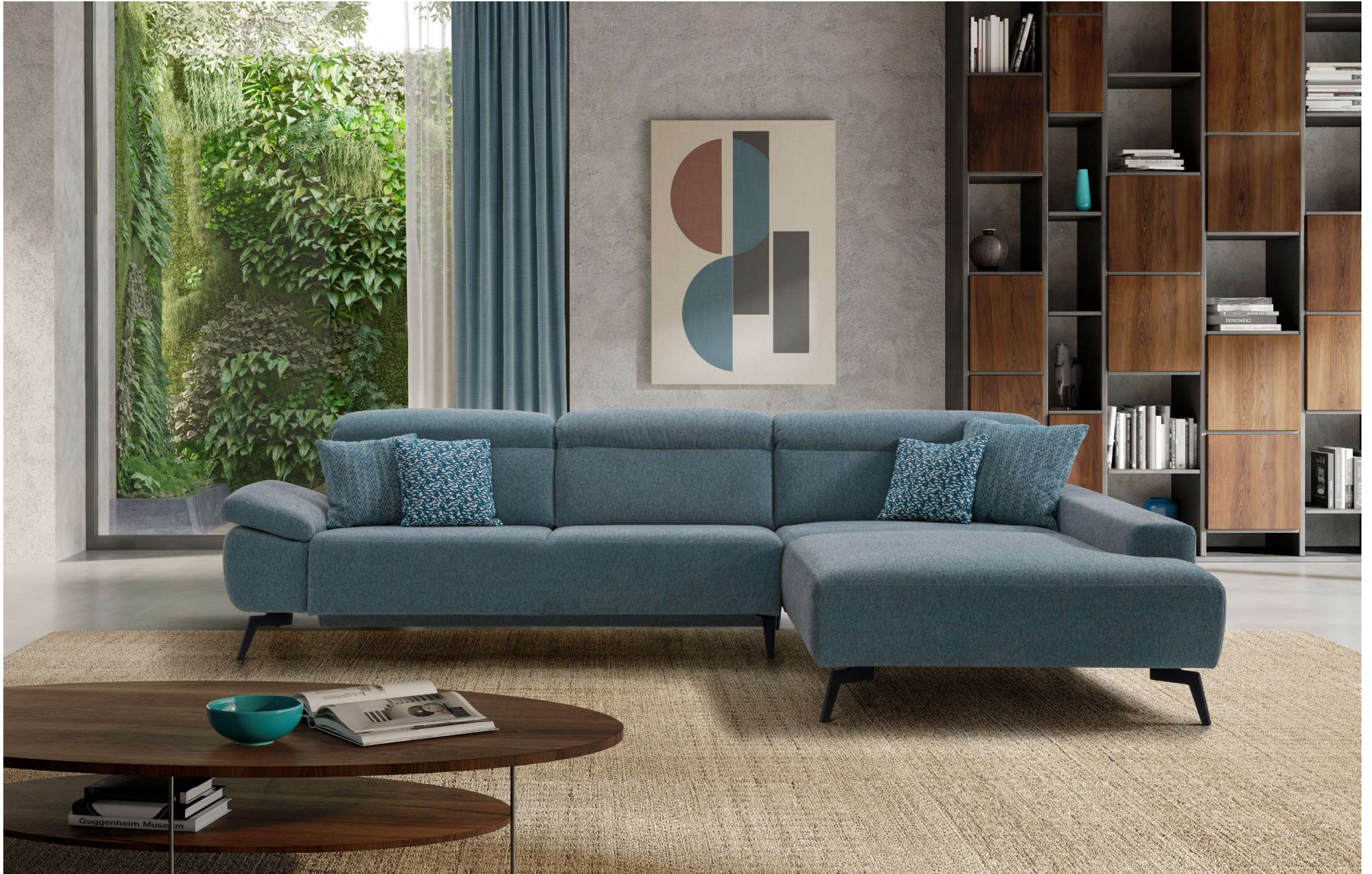
ARTEMIS | BS-L hoch, S16E niedrig, LC-R hoch | Fuss Nr 26 schwarz glänzend