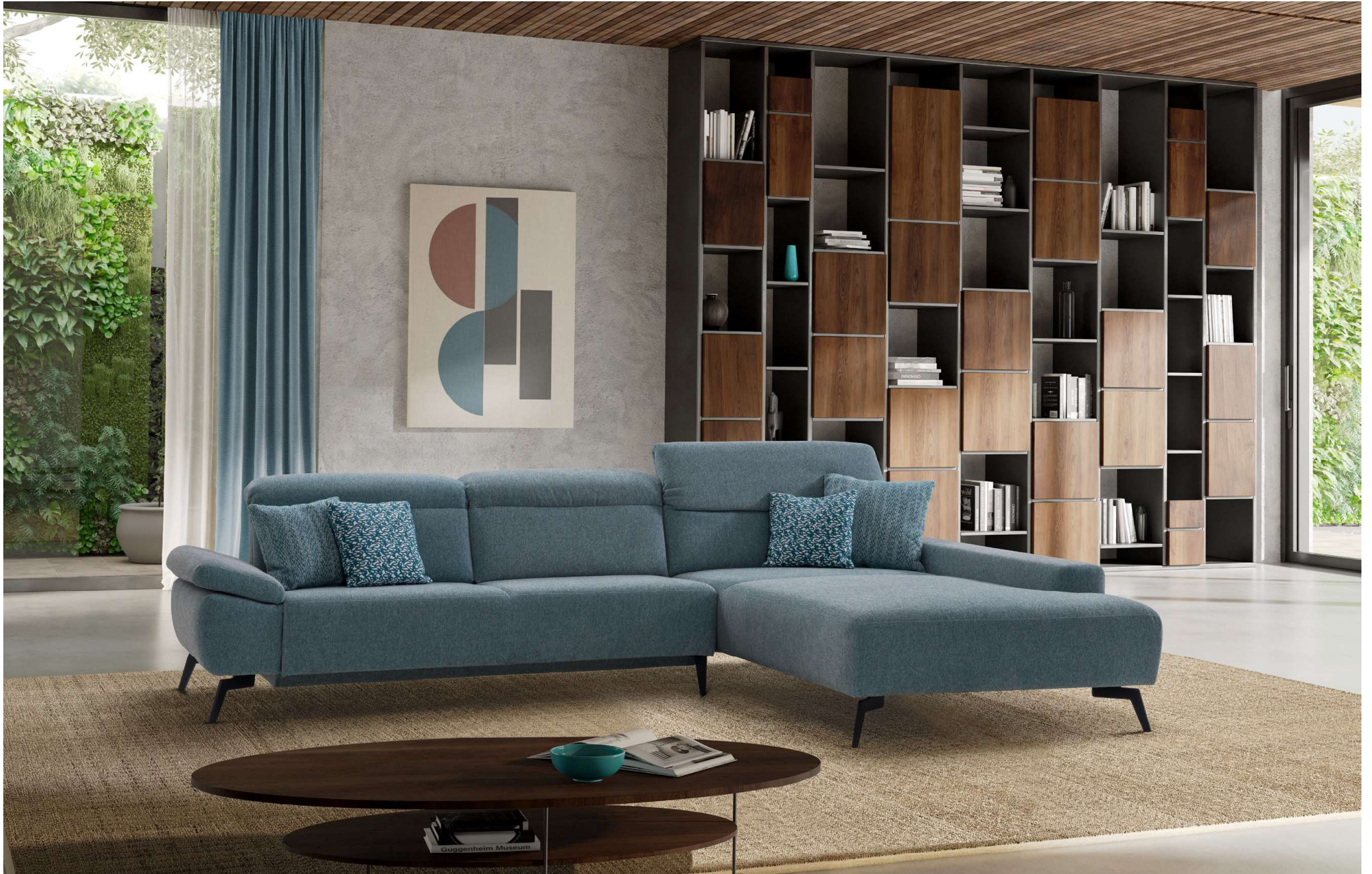
DARIA | AT20-L, S16E, CC-R mit Infrarot Tiefenwärme | Fuss Nr 29 schwarz matt