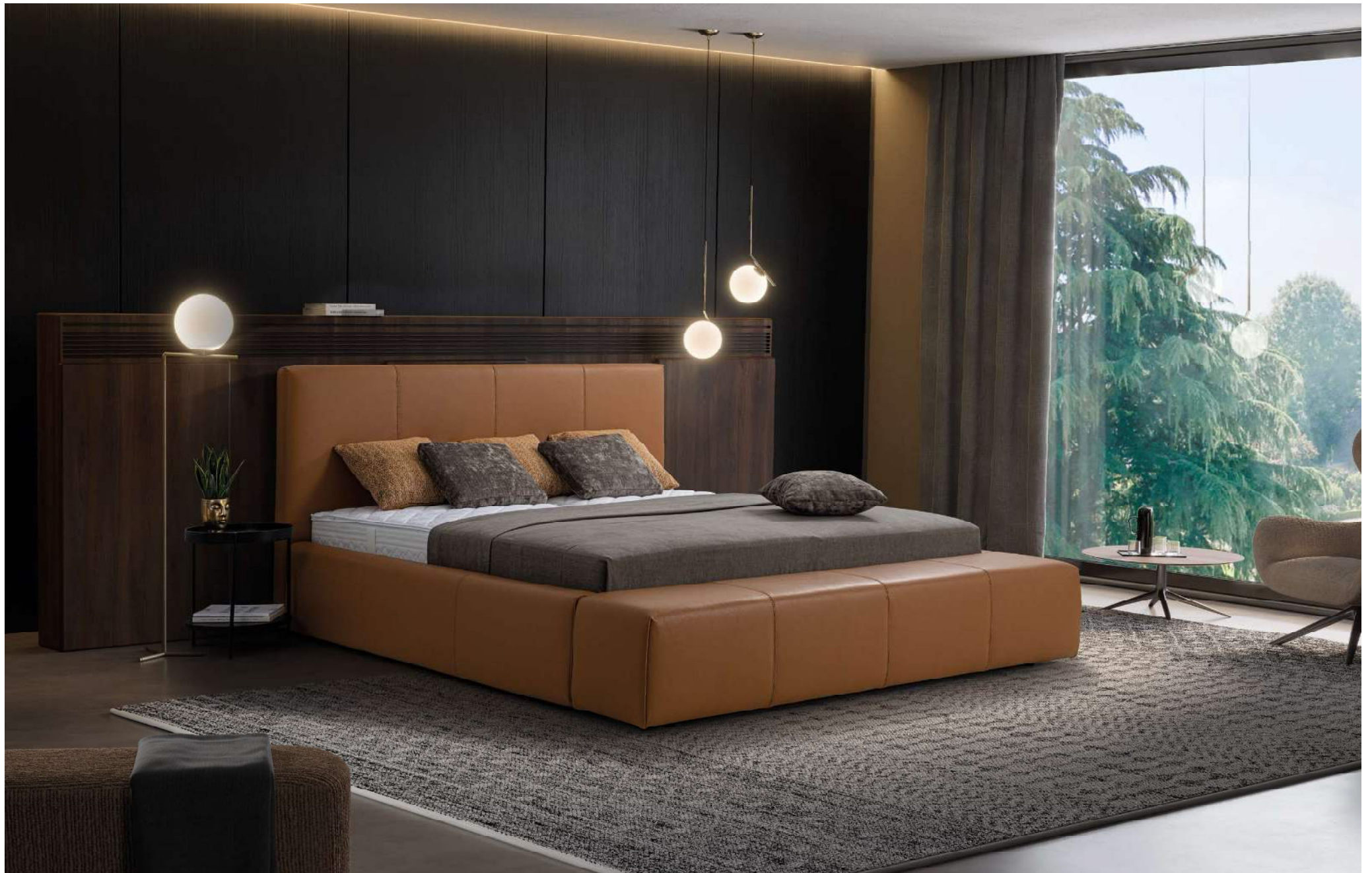
DUKE | Boxspringbett mit Polsterbank BETT180B | Liegefläche 180 x 200 cm | Außenmaß 204 x 247 cm