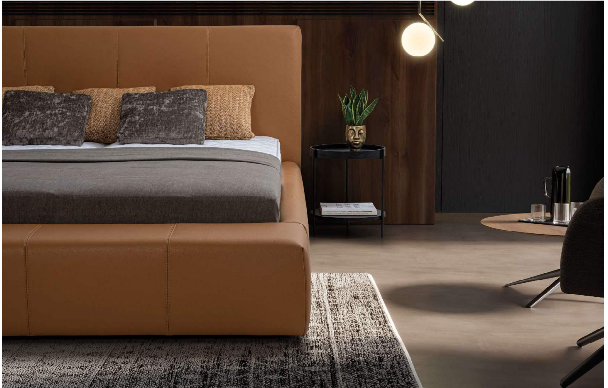
DUKE | Boxspringbett mit voluminösem Polsterrahmen (verhindert Verrutschen der Matratze)