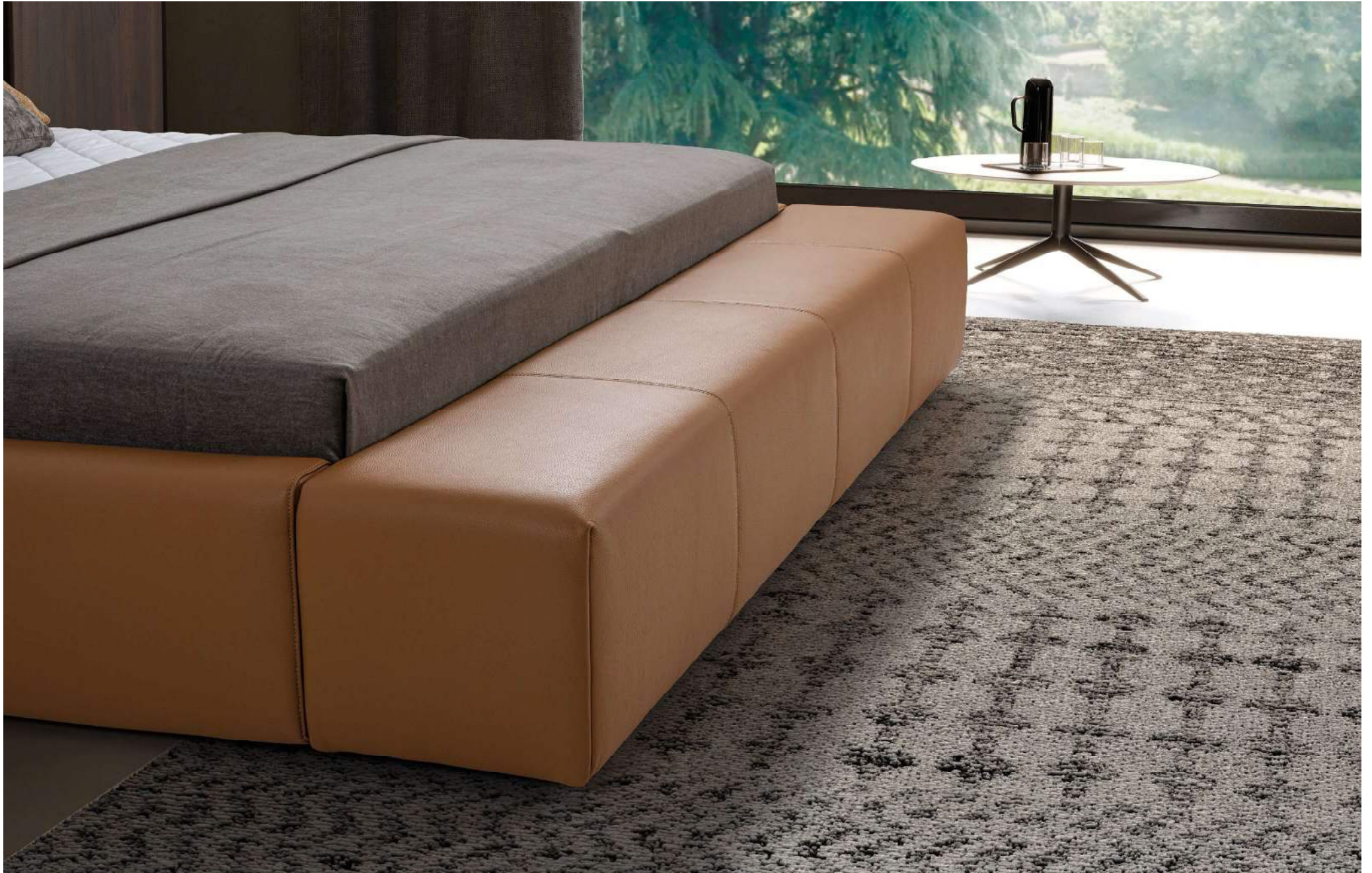
DUKE | optionale Polsterbank am Fußende des Bettes