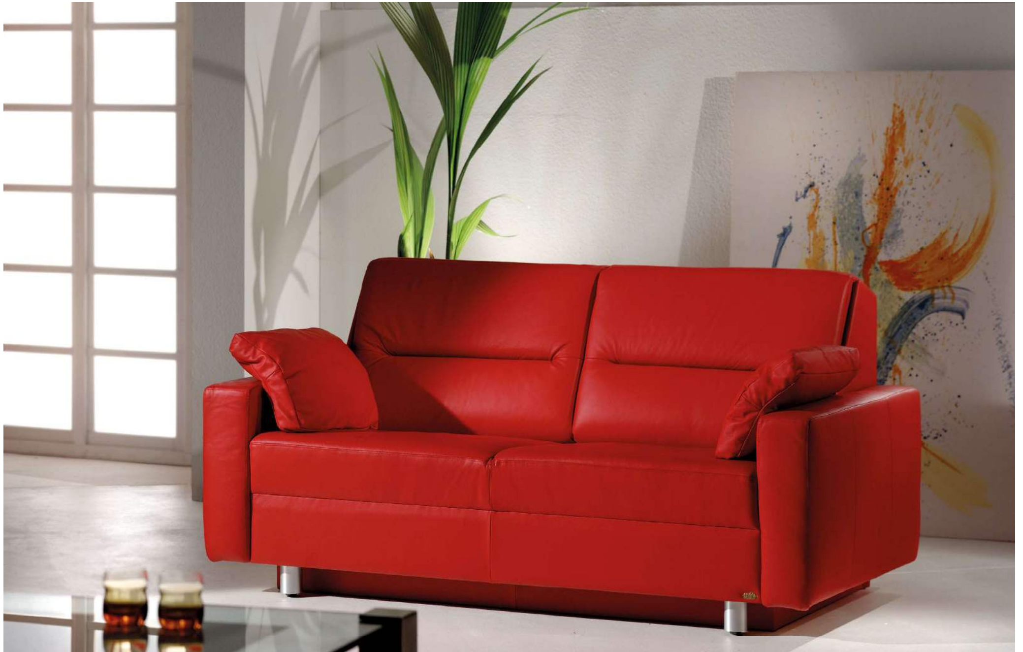
PRAGMA | D145, AT-B | Fuss Nr 51 Alu matt