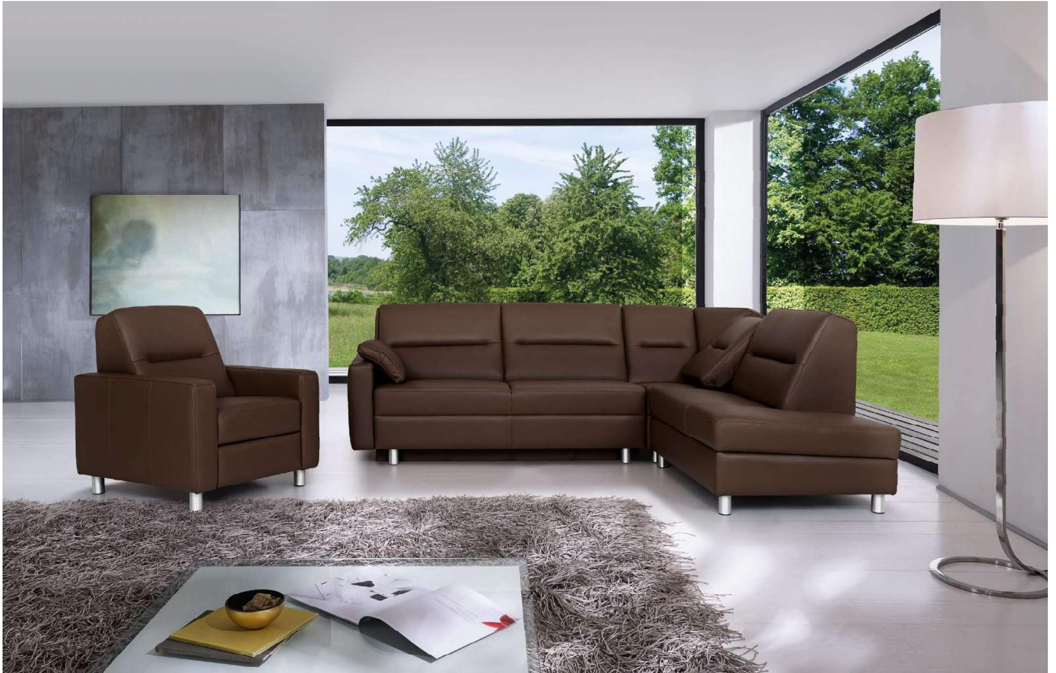
PRAGMA | AT-L, D162, RXE, AS2-R, F | Fuss Nr 51 Alu matt