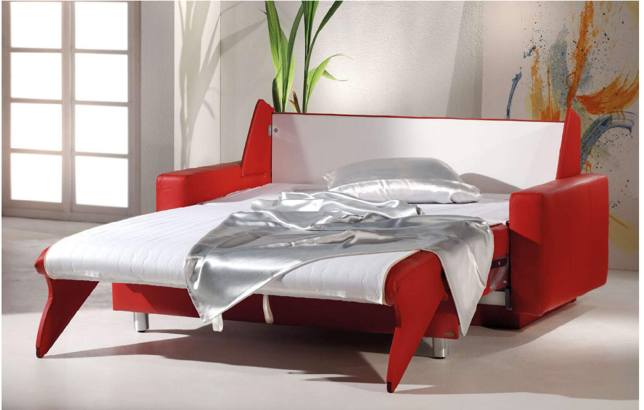
PRAGMA | easy Längsschläfer Bettfunktion mit automatischem Matratzenschoner und abnehmbarem Leintuch