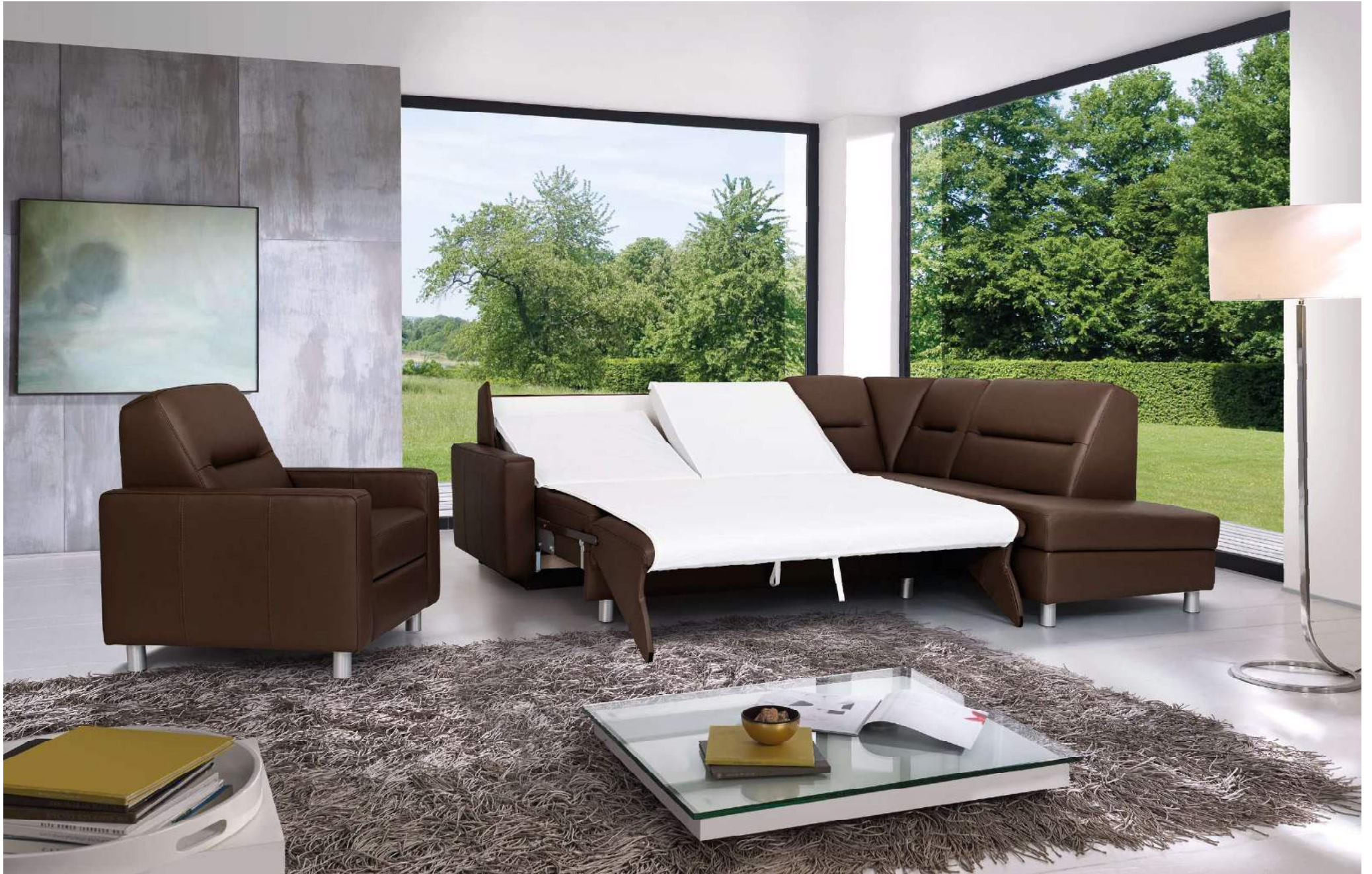
TRIBUN | easy Längsschläfer Bettfunktion mit automatischem Matratzenschoner, abnehmbarem Leintuch, Kopfhochsteller