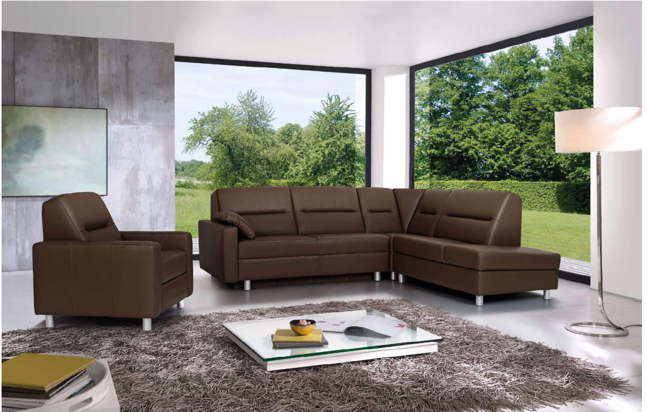
PRAGMA | AT-L, D162, RXE, AS2-R, F | Fuss Nr 51 Alu matt