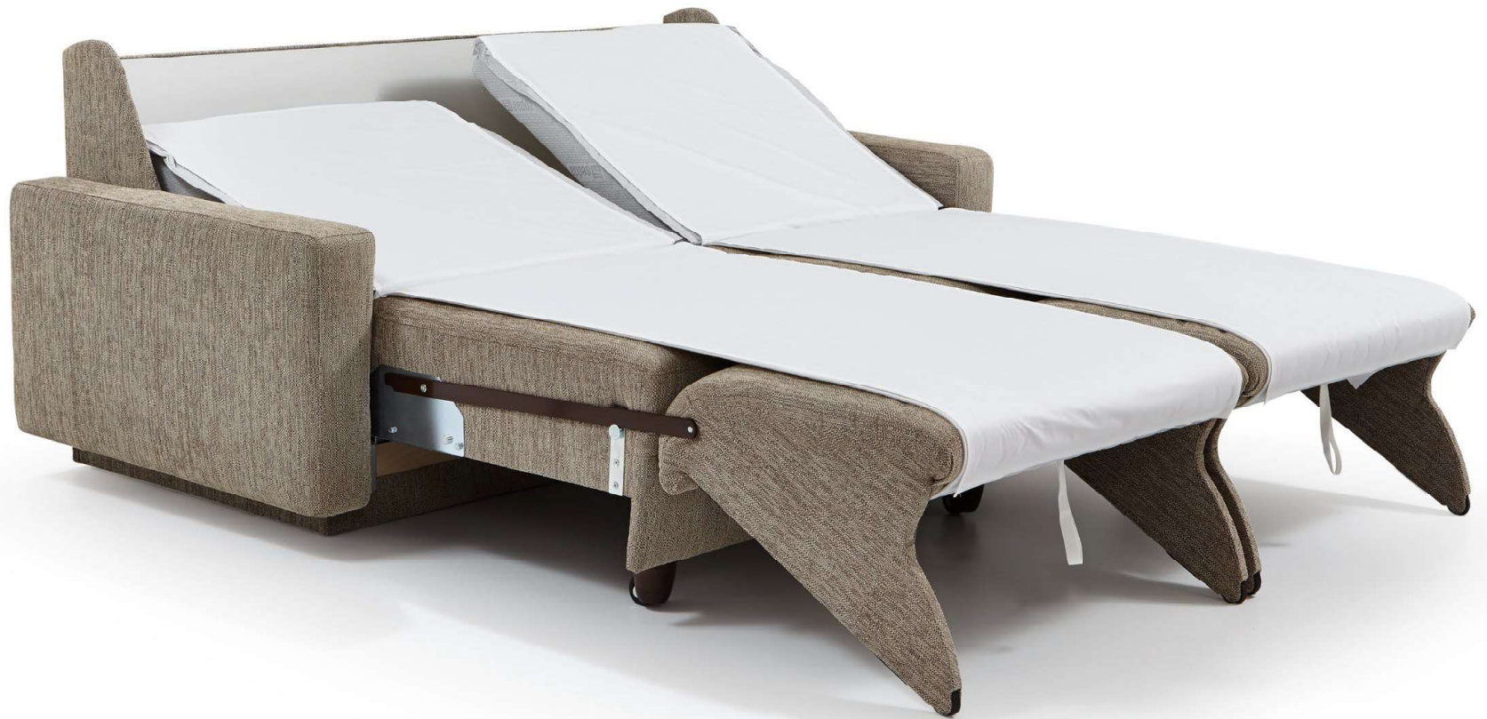
PERLA | easy Längsschläfer Bettfunktion mit automatischem Matratzenschoner, abnehmbarem Leintuch, Kopfhochsteller