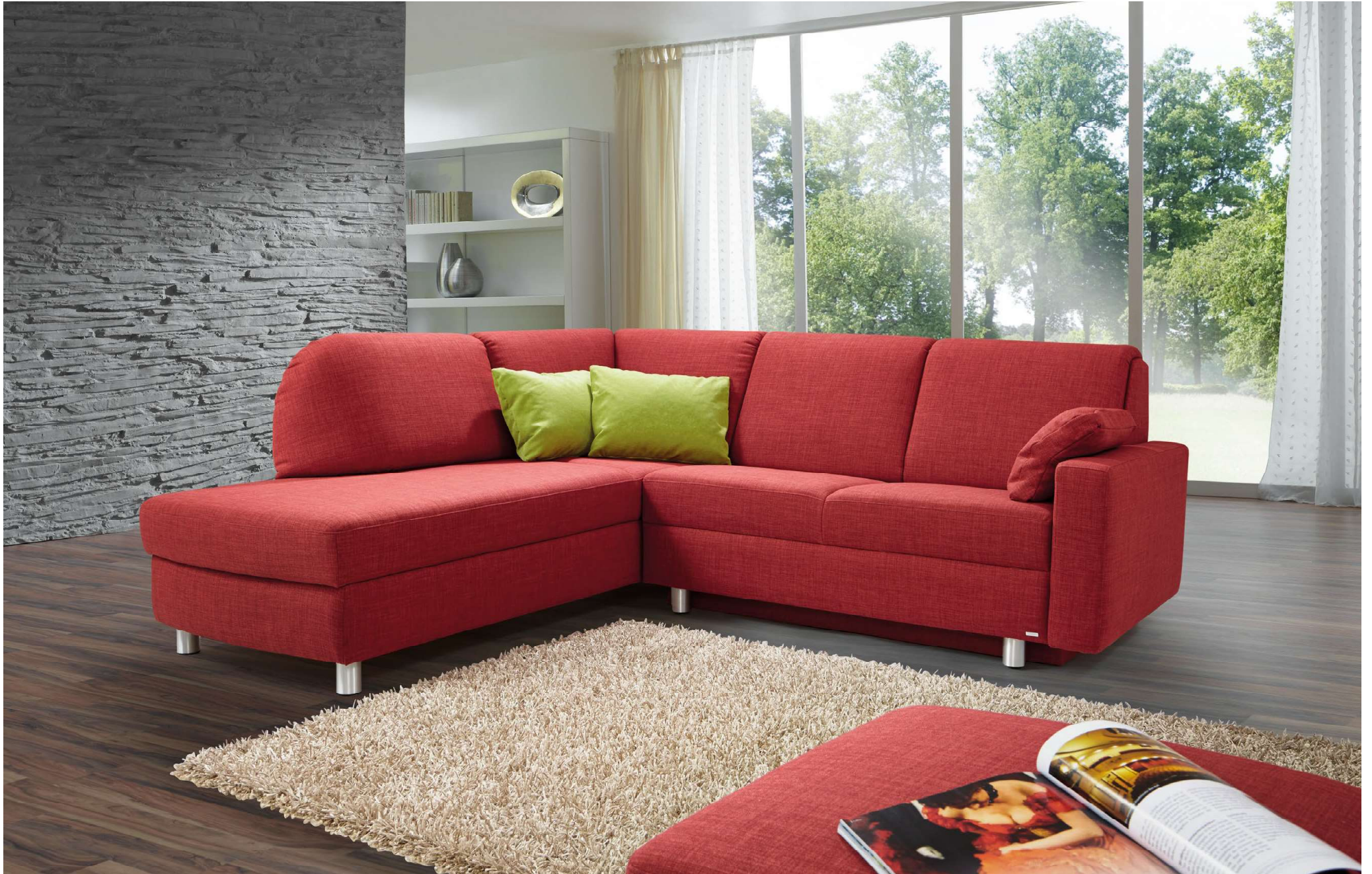
PERLA | L3-L, D130, AT-R | Fuss Nr 51 Alu matt