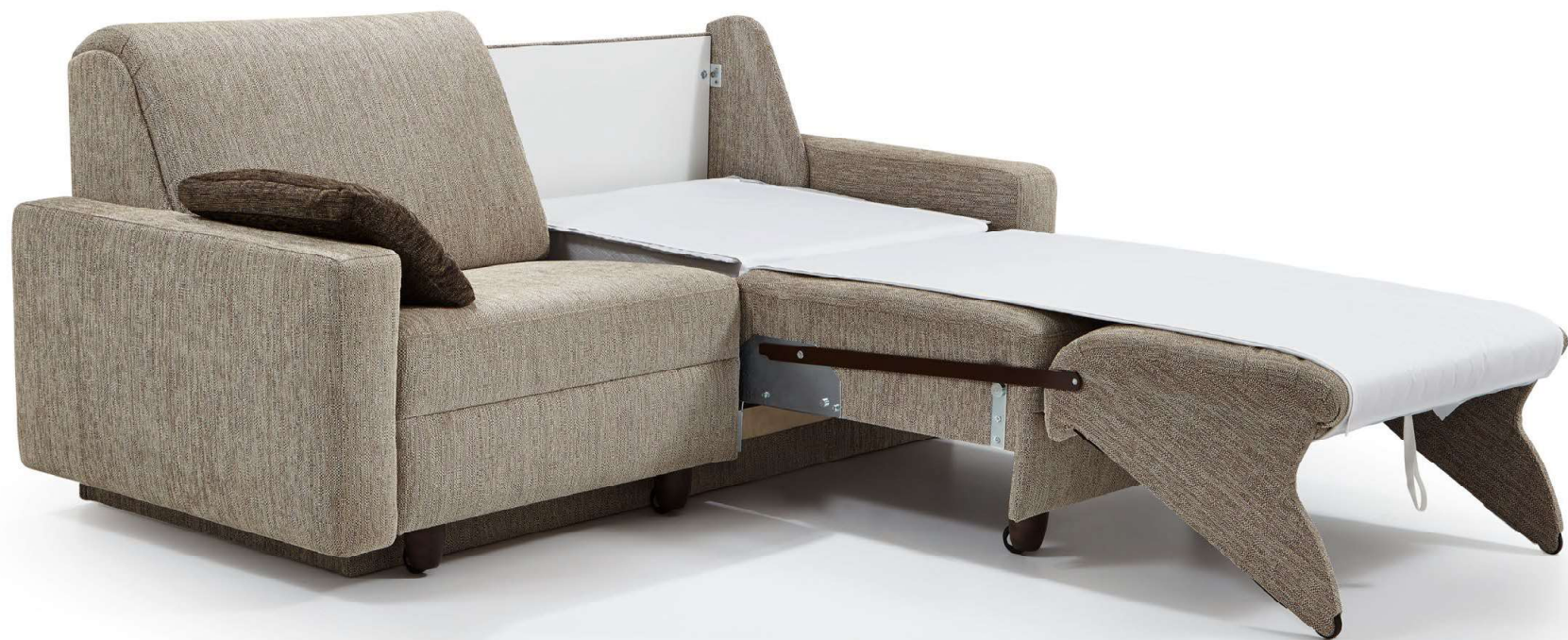
PERLA | easy Bettfunktion Einzelauszug