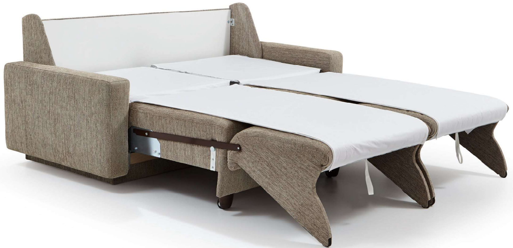
PERLA | easy Längsschläfer Bettfunktion mit automatischem Matratzenschoner, abnehmbarem Leintuch