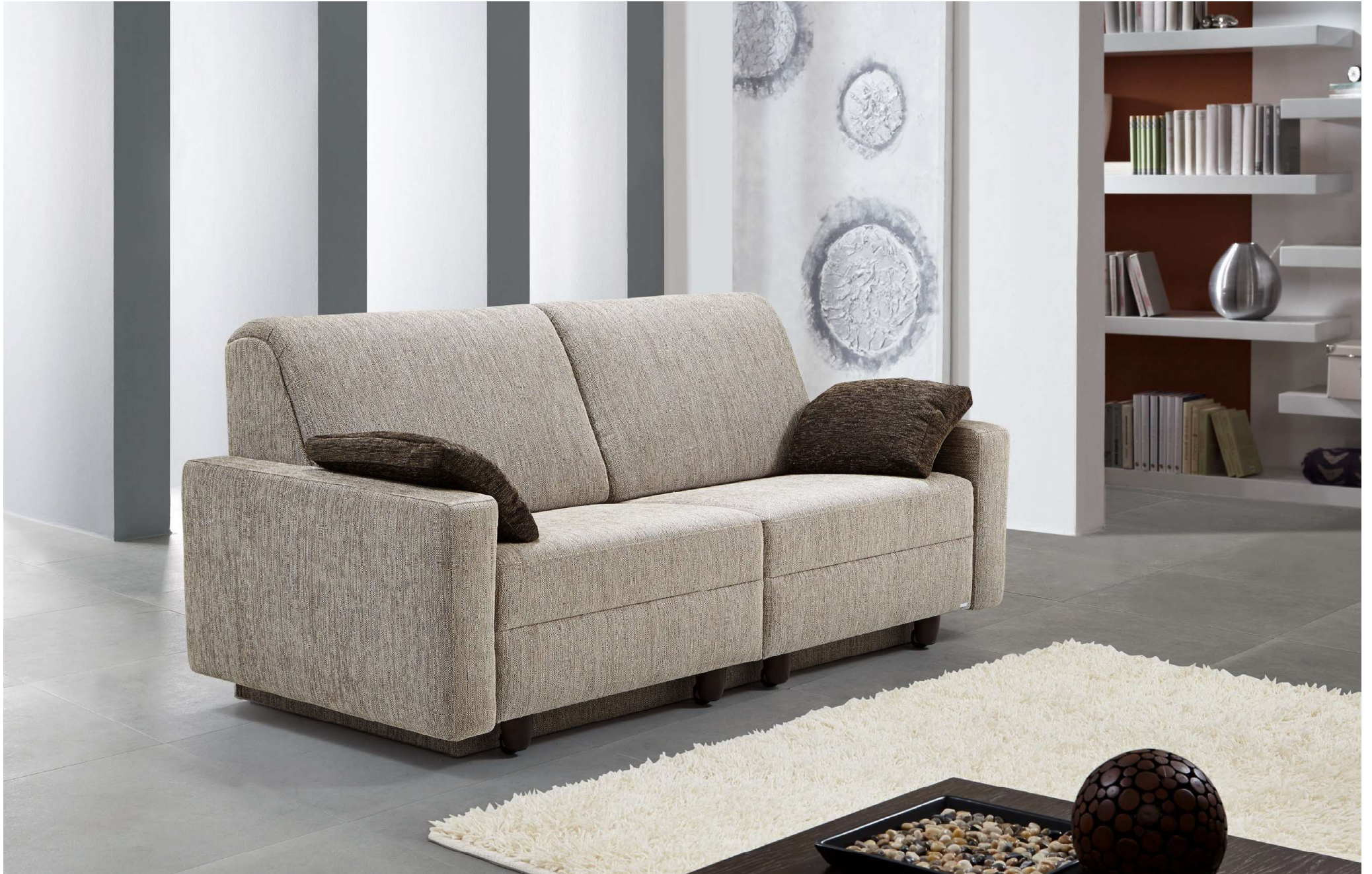
PERLA | D16E, AT-B | Fuss Nr 50 Wenge