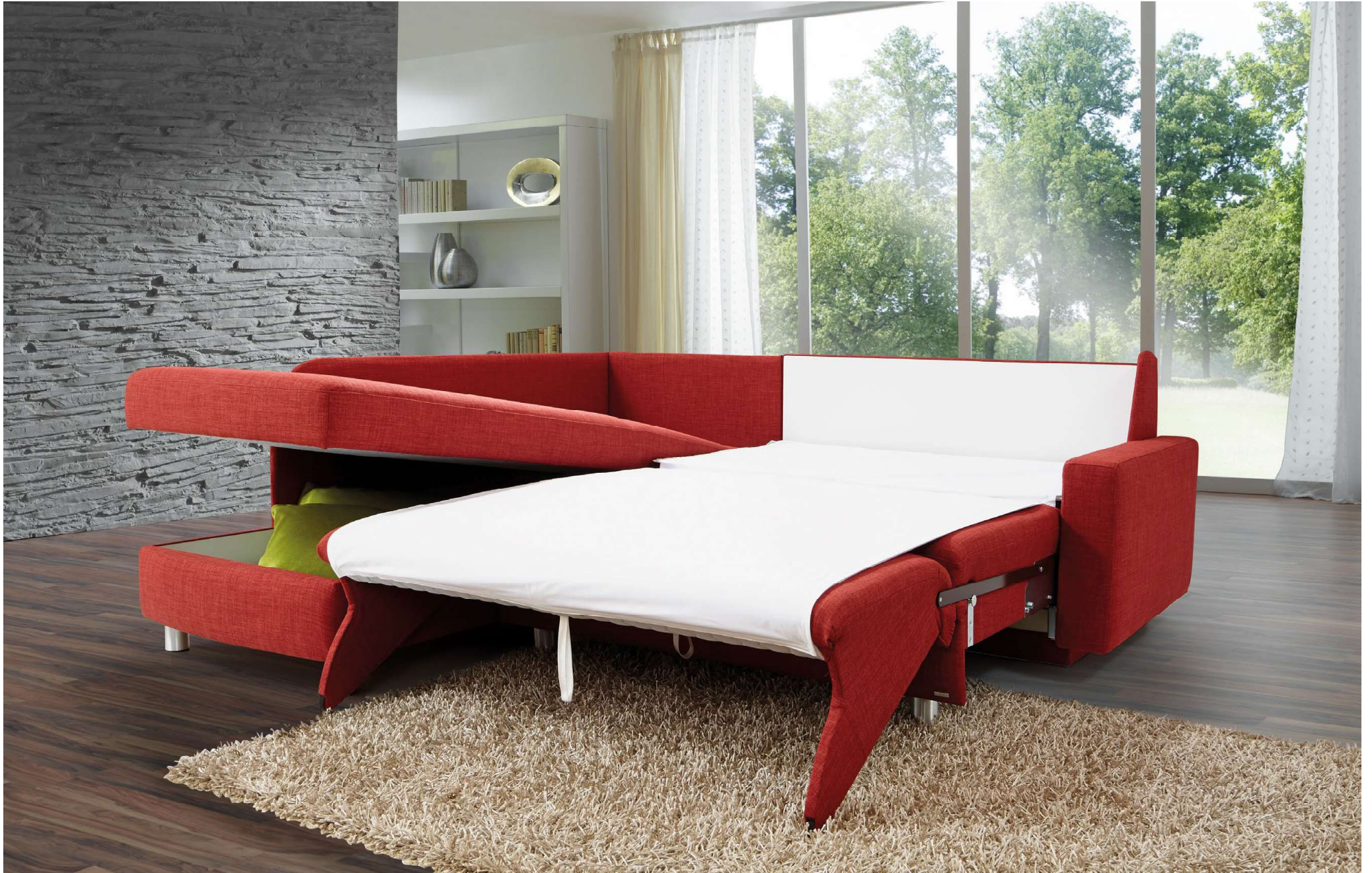
PERLA | Stauraum in Liege 3-sitzig (L3)