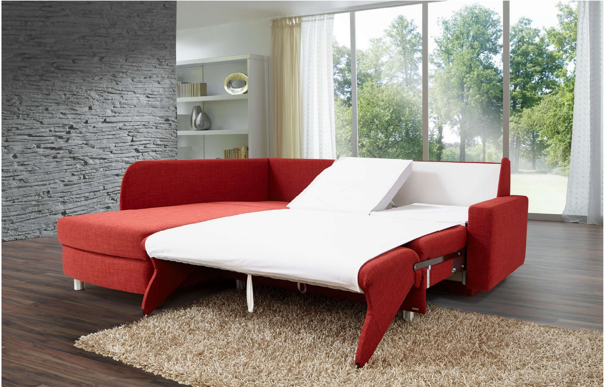
PERLA | easy Längsschläfer Bettfunktion mit automatischem Matratzenschoner, abnehmbarem Leintuch, Kopfhochsteller