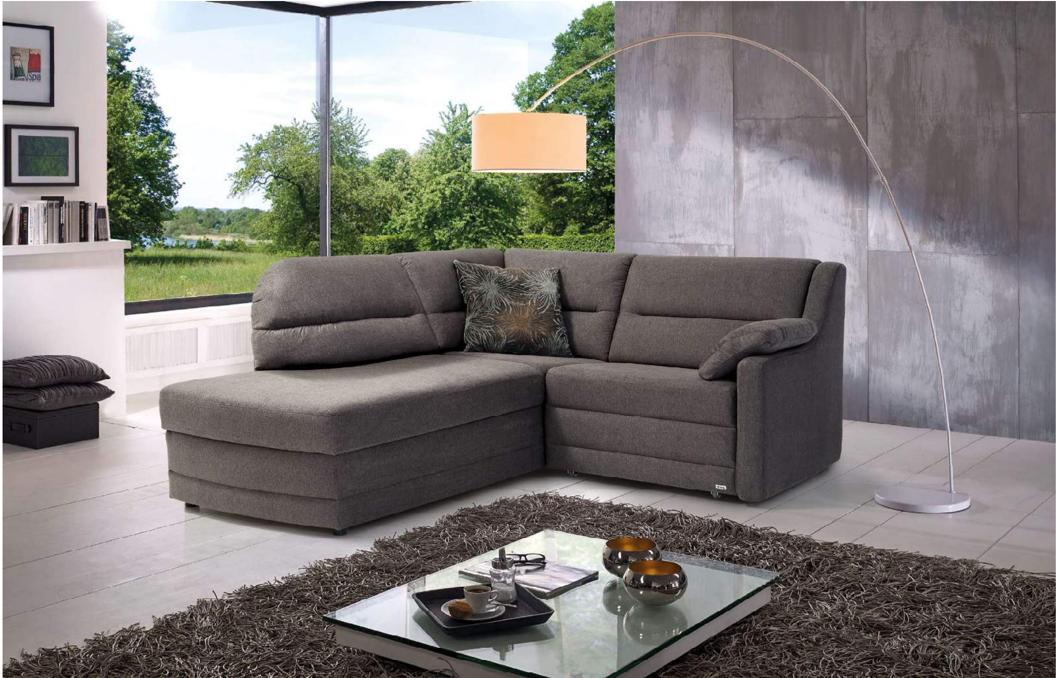
OBJEKT | L3-L, AZE, AT-R | Gleiter