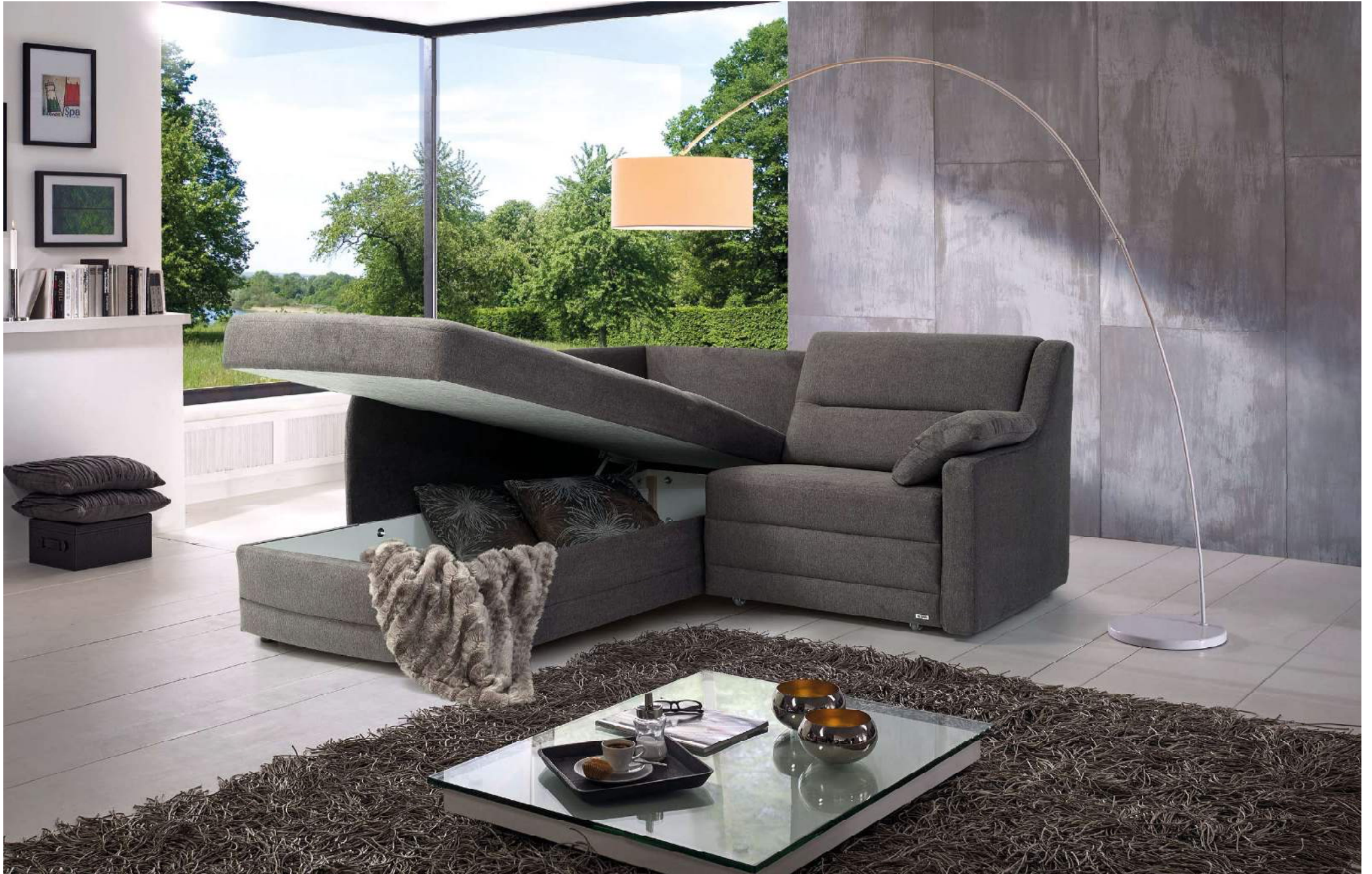
OBJEKT | Stauraum in Liege 3-sitzig (L3)