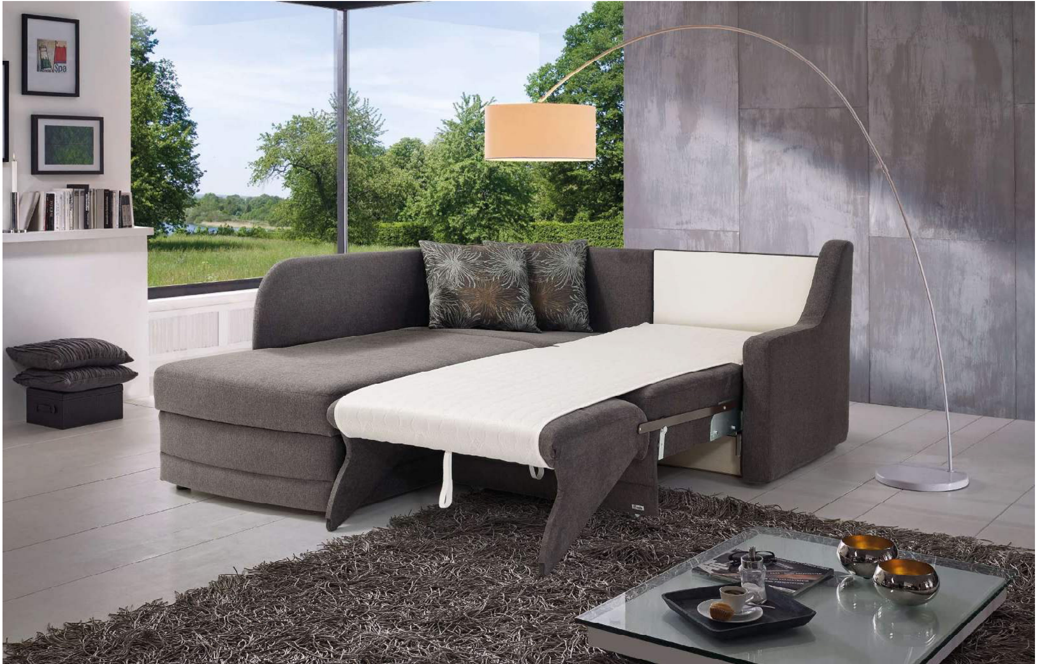
OBJEKT | easy Längsschläfer Bettfunktion mit automatischem Matratzenschoner