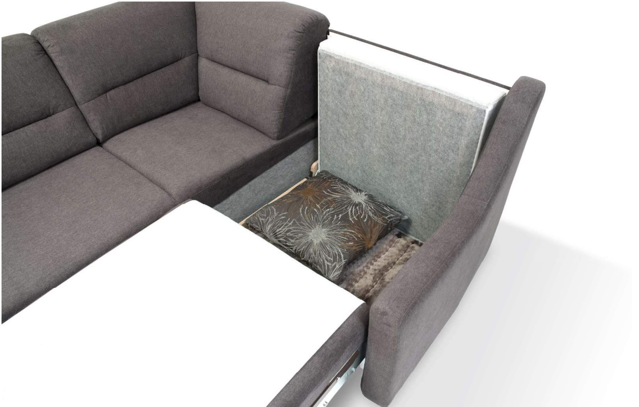
OBJEKT | easy Stauraum in Ausziehelement 82 cm (AZE)