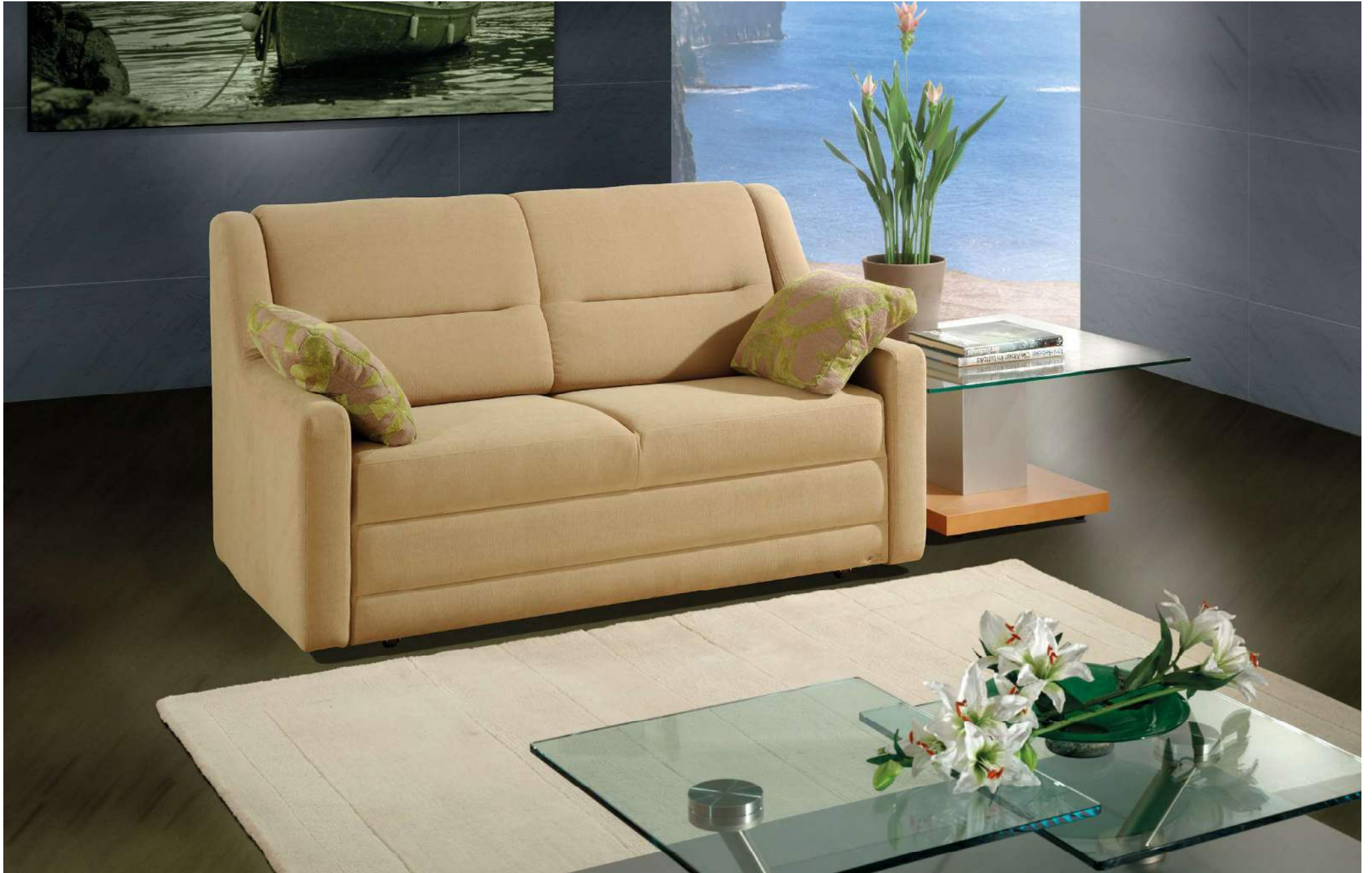
OBJEKT | D130, AT-B | Gleiter