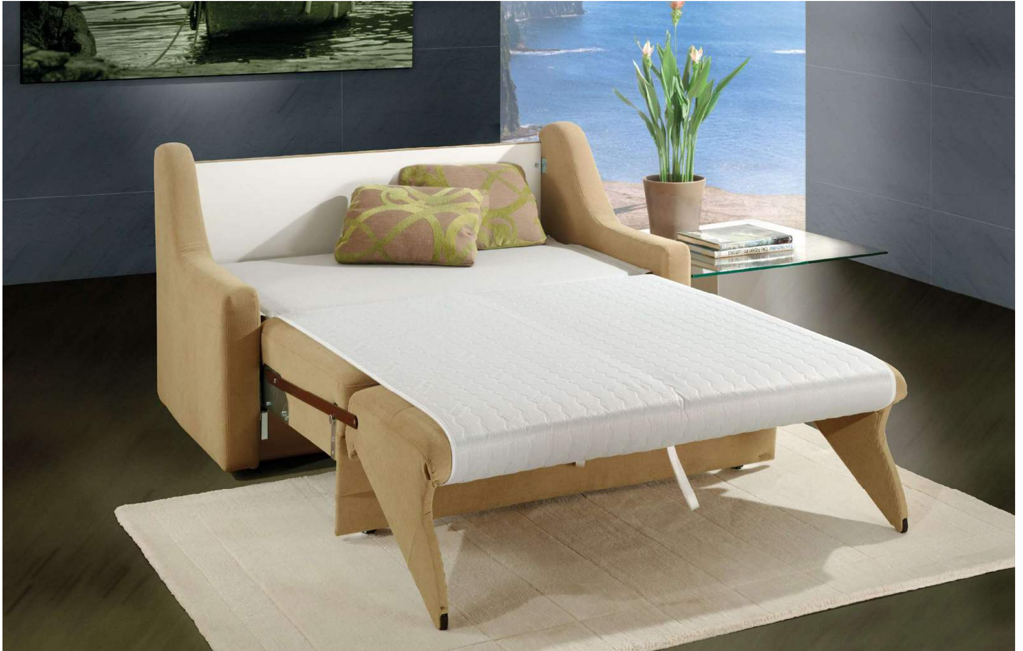
OBJEKT | easy Längsschläfer Bettfunktion mit automatischem Matratzenschoner