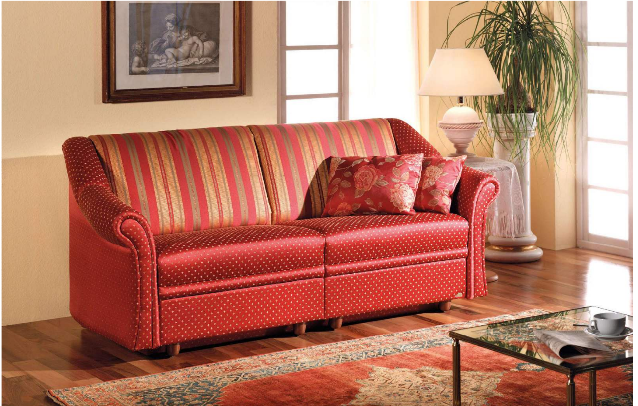
IDYLLE | D16E, AT-B | Fuss Nr 50 Nuss, Komforthöhe