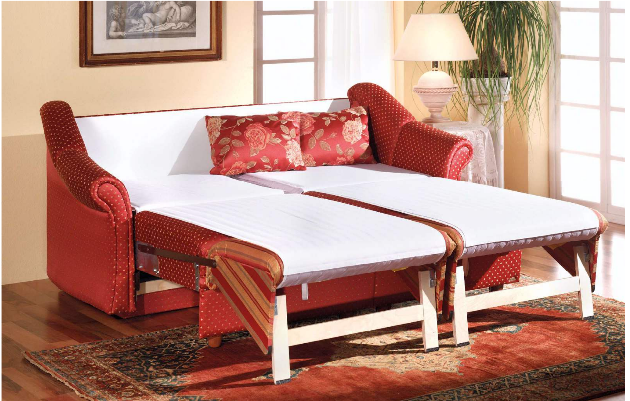
ORBIT | easy Längsschläfer Bettfunktion mit automatischem Matratzenschoner, abnehmbarem Leintuch