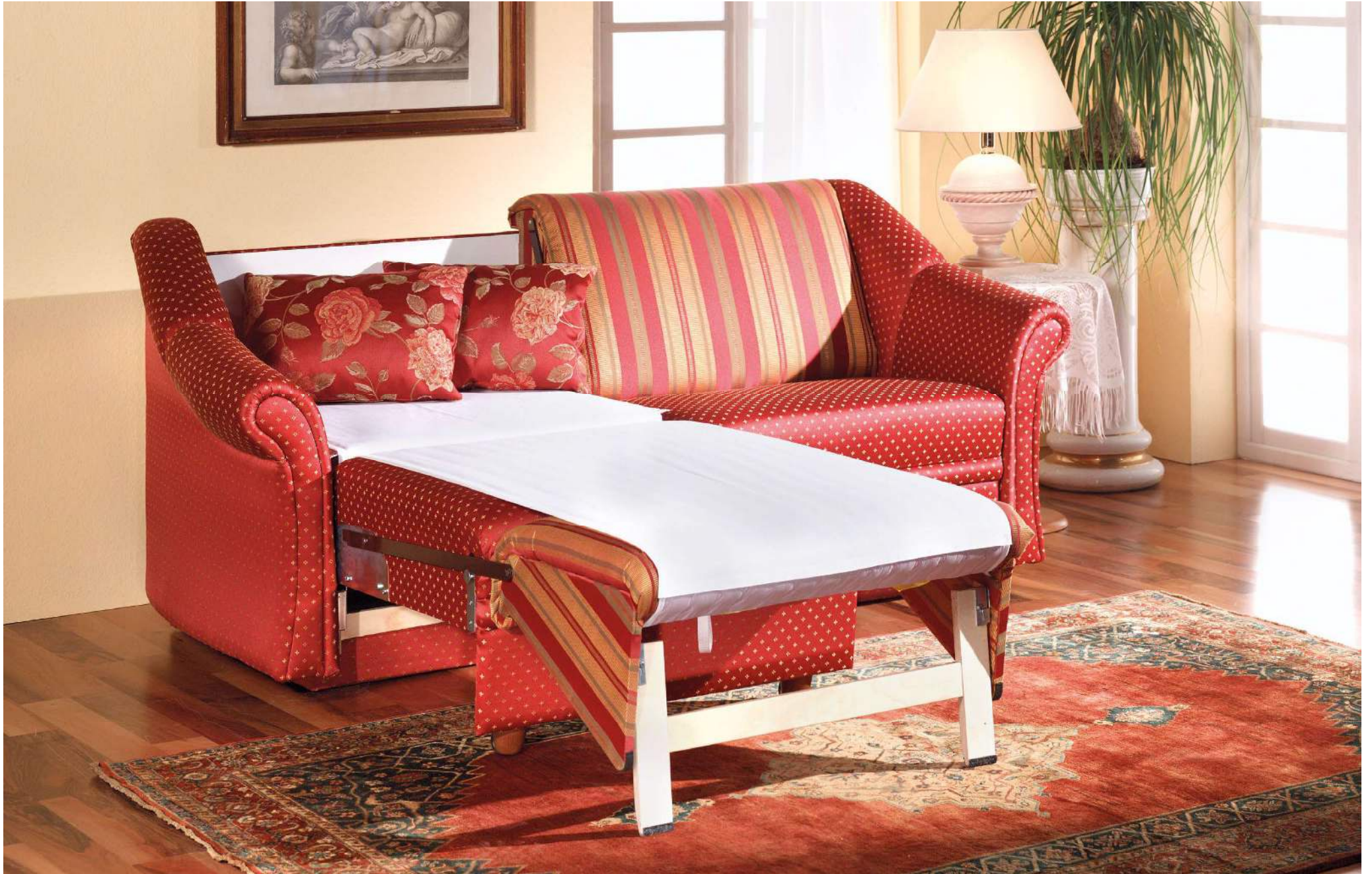
IDYLLE | easy Bettfunktion Einzelauszug