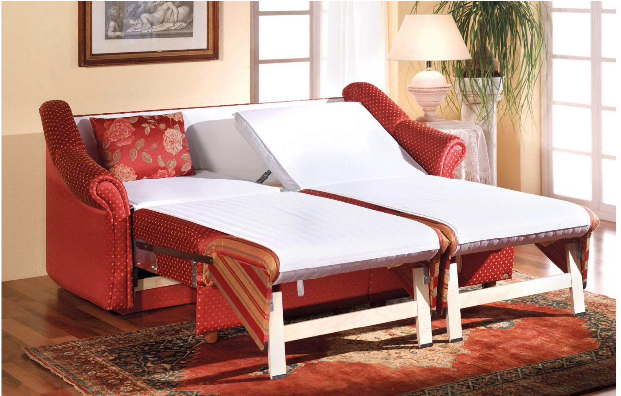
IDYLLE | easy Längsschläfer Bettfunktion mit automatischem Matratzenschoner, abnehmbarem Leintuch, Kopfhochsteller