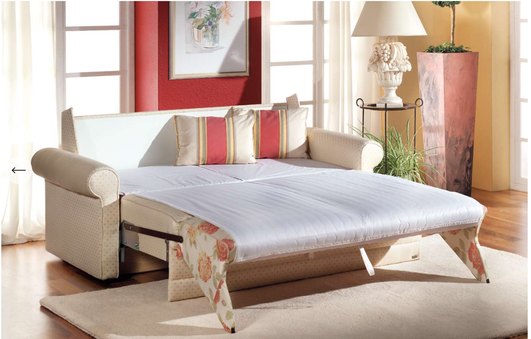
ORBIT | easy Längsschläfer Bettfunktion mit automatischem Matratzenschoner, abnehmbarem Leintuch