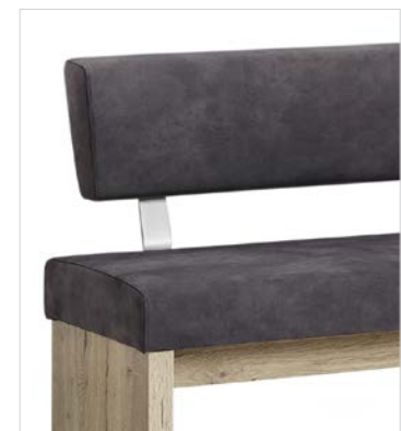
Variante 2 (kurze Lehne)