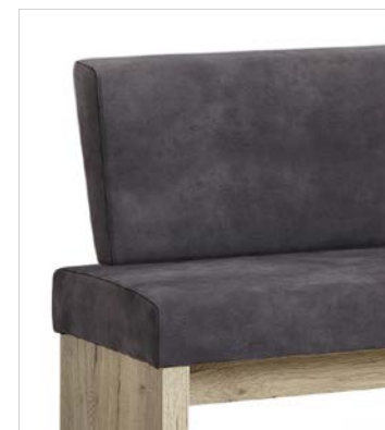
Variante 1 (lange Lehne)