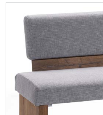
Variante 3 (Kombi Polster/Holz)