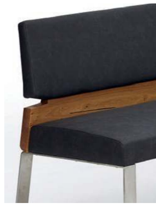
Variante 1 (Polsterlehne)