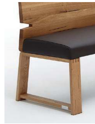
Variante 2 (Holzkufe massiv)