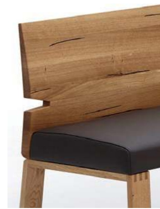
Variante 2 (Lehne massiv)