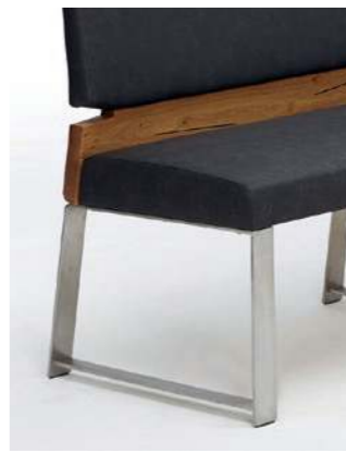
Variante 1 (Edelstahlkufe gebürstet)