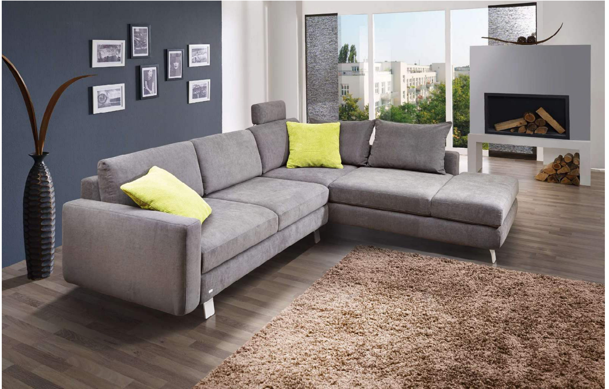
SANDRO | AT-L, M160, LC-R | Fuss Nr 21 Alu matt