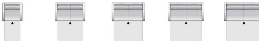
M80ATB Multibett 80 cm mit 2 Armteilen M130ATB Multibett 130 cm mit 2 Armteilen M145ATB Multibett 145 cm mit 2 Armteilen M160ATB Multibett 160 cm mit 2 Armteilen M180ATB Multibett 180 cm mit 2 Armteilen