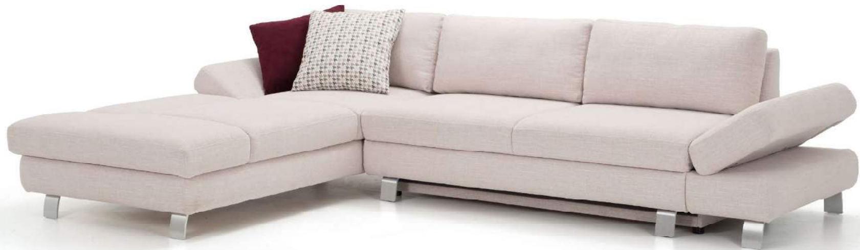
SANDRO | RC-L, M160, SAK-R | Fuß Nr 21 Alu matt