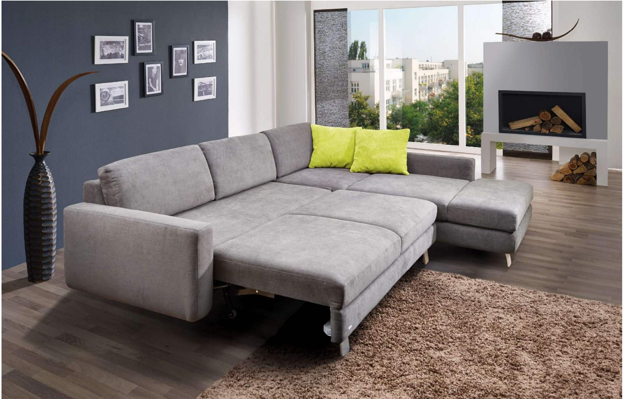
SANDRO | quickmulti TV-Liege (M160) | Liegebreite ca 240 cm mit Longchair