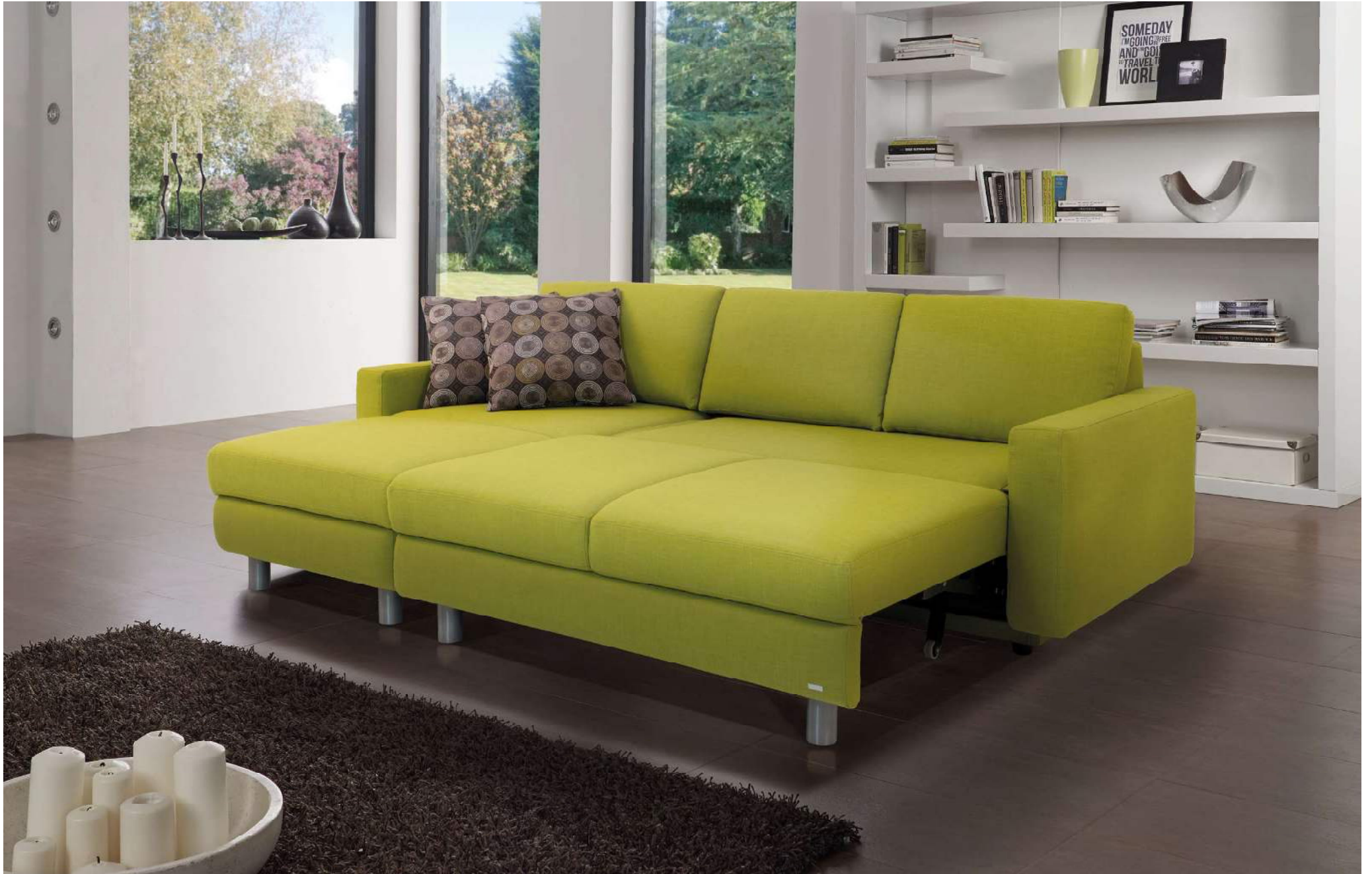
SANDRO | quickmulti TV-Liege (M130) | Liegebreite ca 210 cm mit Liegesofa