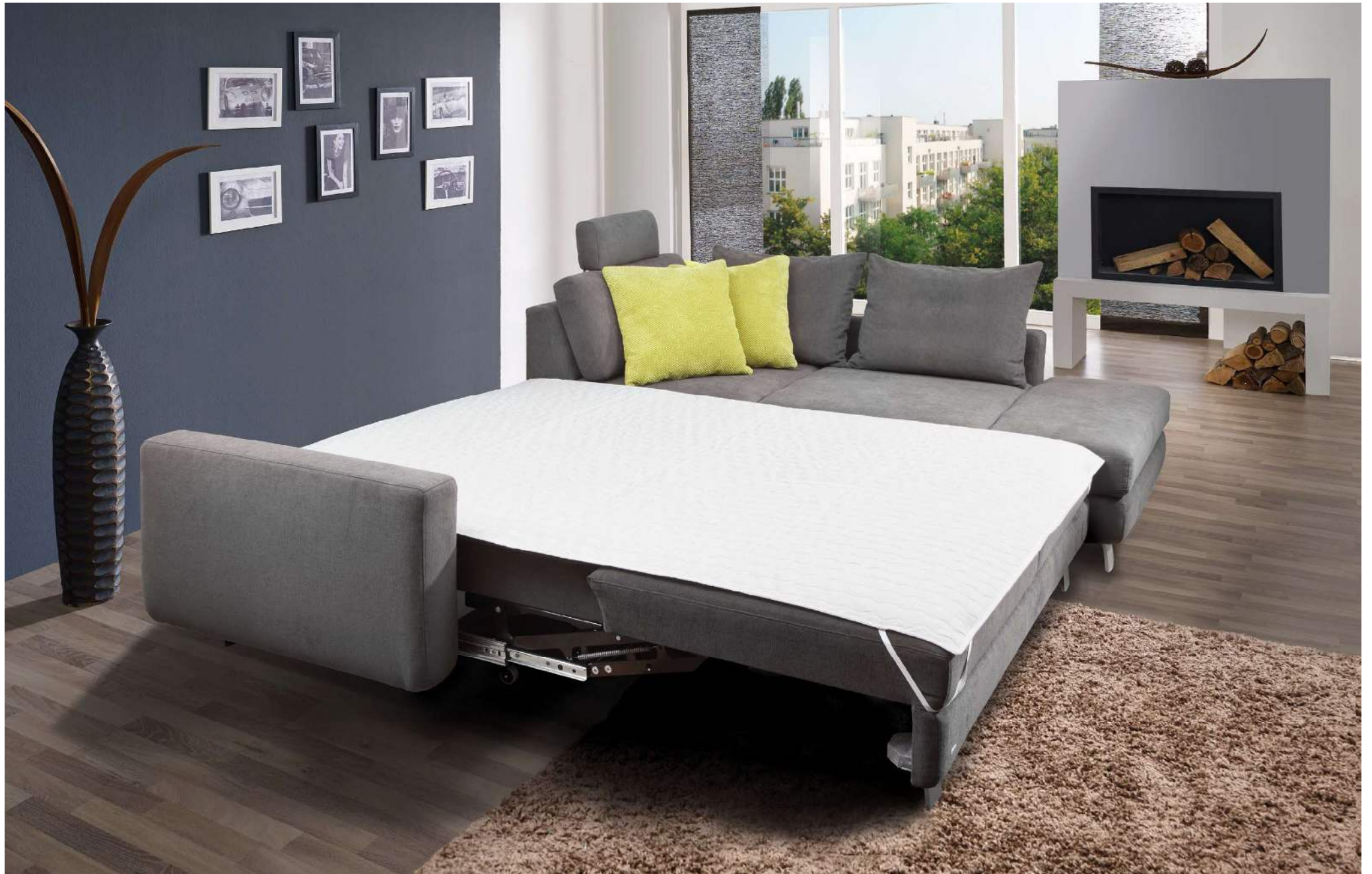
SANDRO | quickmulti Längsschläfer Bett (M160) mit optionalem Matratzenschoner | Liegefläche ca 160 x 200 cm