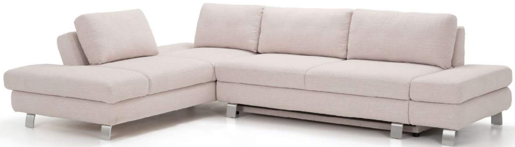
SANDRO | hochklappbare Rückenlehne bei Relaxchair