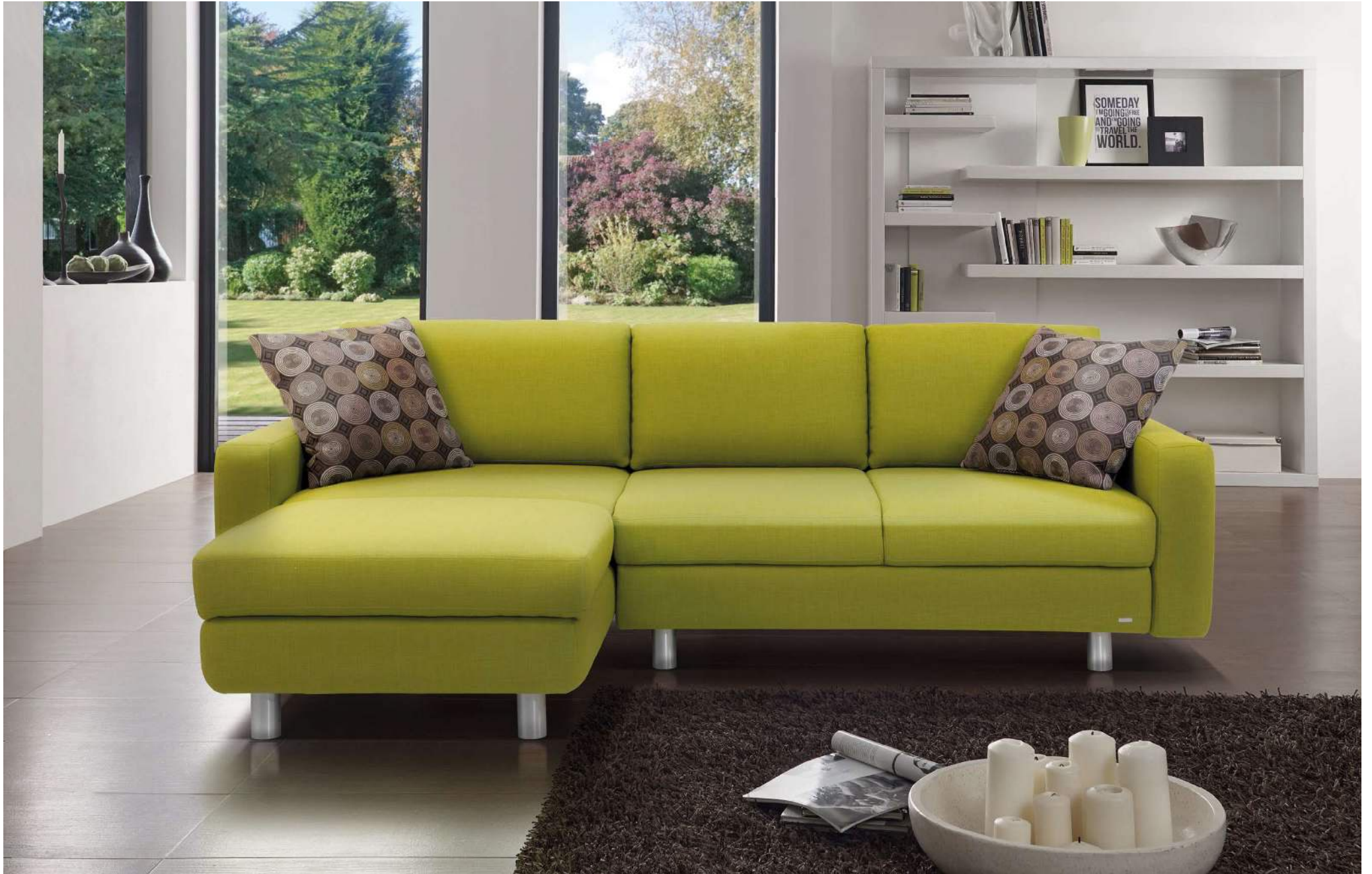
SANDRO | LSAZ-L, M130, AT-R | Fuß Nr 21 Alu matt