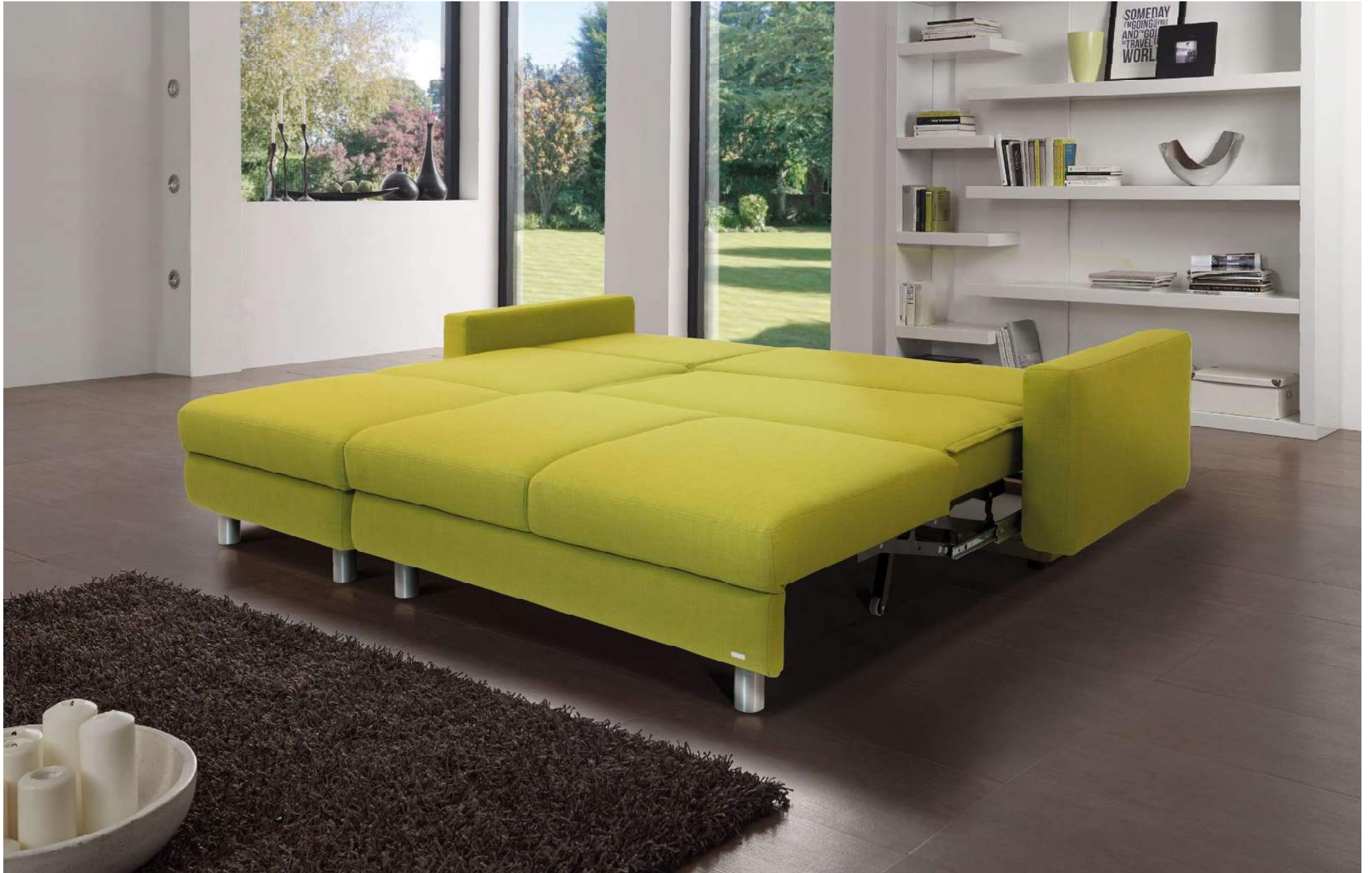
SANDRO | quickmulti Längsschläfer Bett (M130) kombiniert mit Liegesofaauszug (LSAZ) | Liegefläche ca 210 x 200 cm