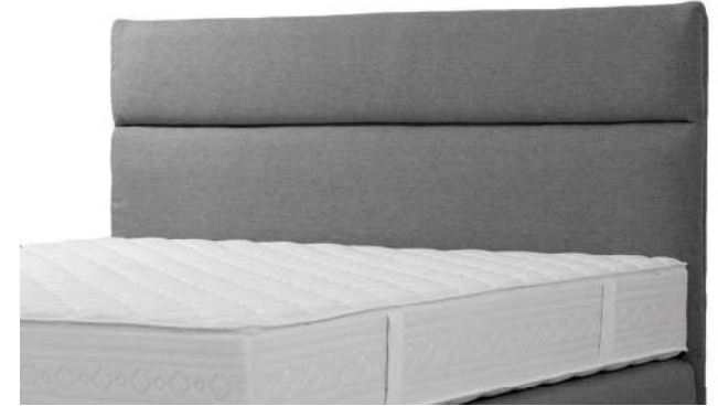
Kopfhaupt C Quersteppung