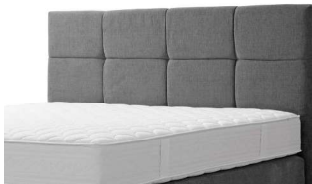
Kopfhaupt E große Karosteppung