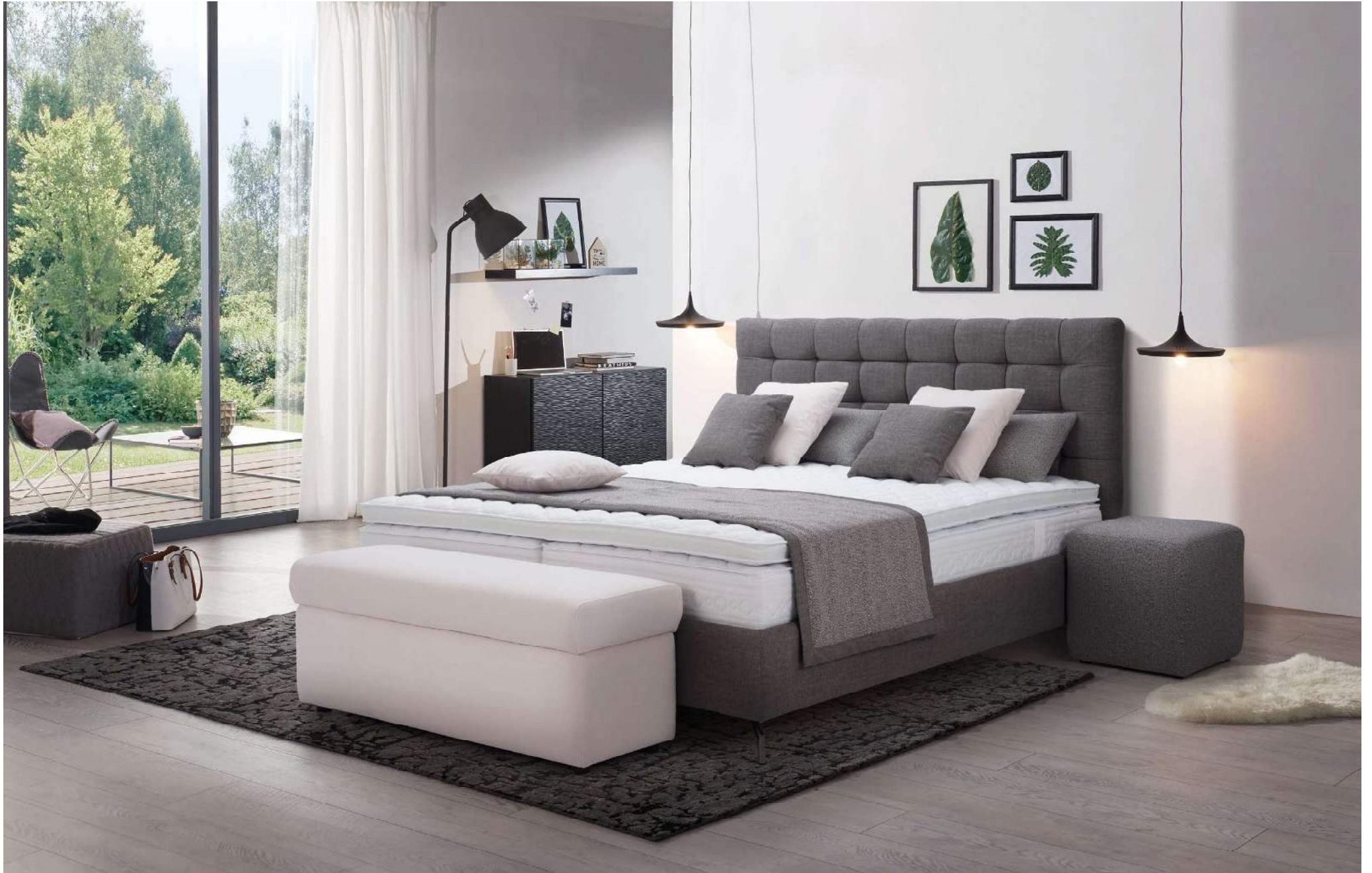
KING | Boxspringbett System | Liegefläche 180 x 200 cm | Kopfhaupt B, Stauraumbox BOX S, Fuß Nr 26 schwarz glänzend, Topper