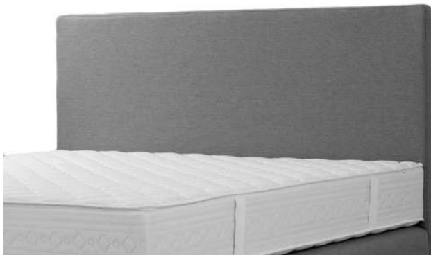
Kopfhaupt D glatt, ohne Steppung