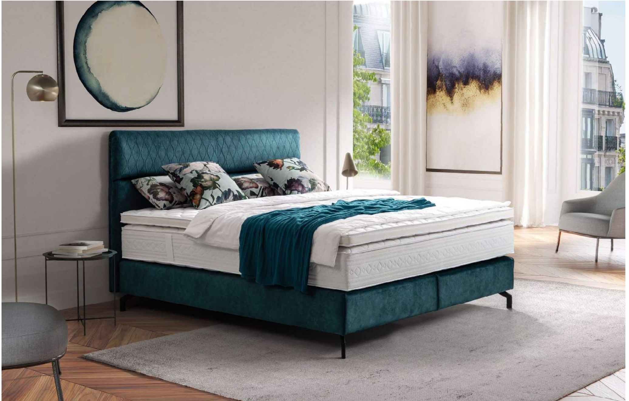
KING | Boxspringbett System | Liegefläche 180 x 200 cm | Kopfhaupt D, Boxspringbox BOX F, Fuß Nr 26 schwarz matt, Matratze mit Partnerbezug, Topper