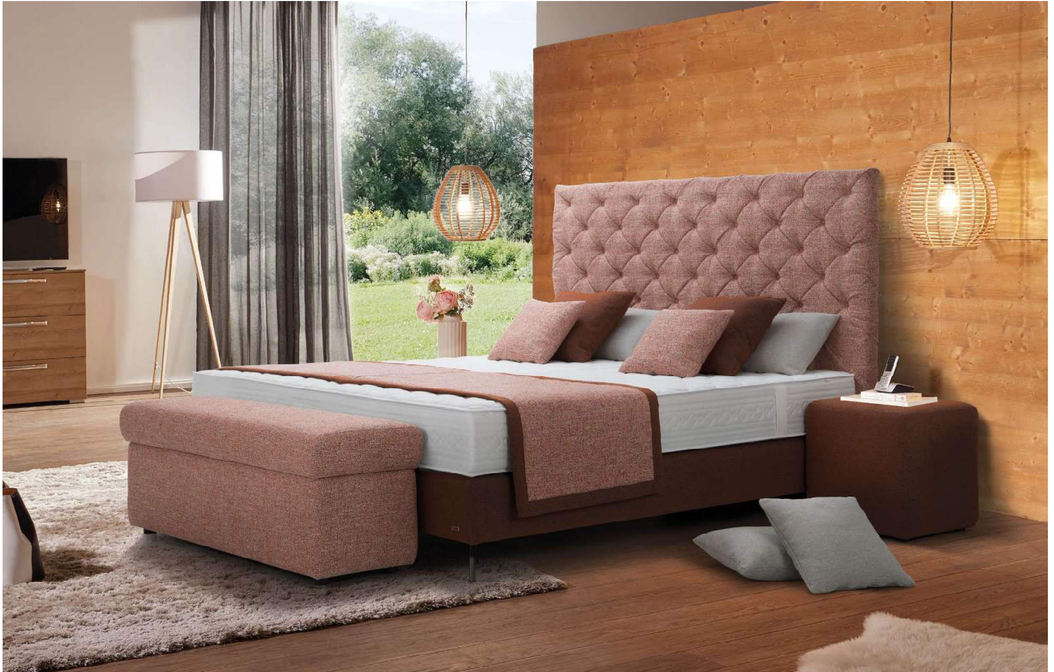
KING | Boxspringbett System | Liegefläche 180 x 200 cm | Kopfhaupt A, Boxspringbox BOX F, Fuß Nr 26 schwarz glänzend, Matratze mit Partnerbezug