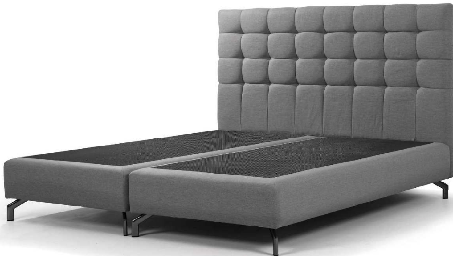
KING | Boxspringbett System | Boxspringbox BOX F bzw Lattenrostbox BOX L (NoSpring, kein Metall), mit eingnähter Antirutschmatte