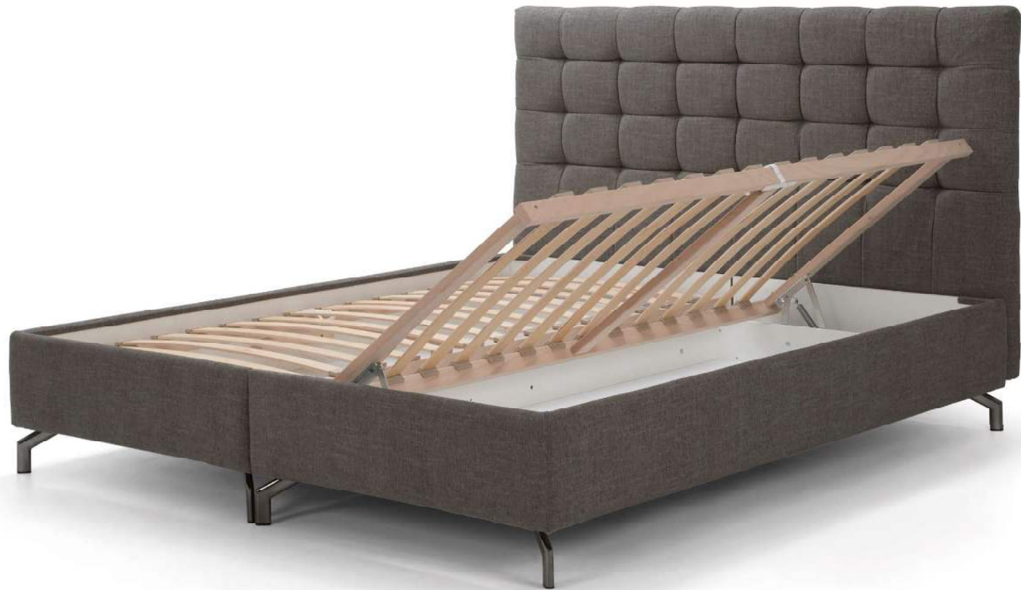
KING | Boxspringbett System | Stauraumbox BOX S mit Lattenrost und seitlichem Kippbeschlag, leichter Rahmen zum Fixieren der Matratzen