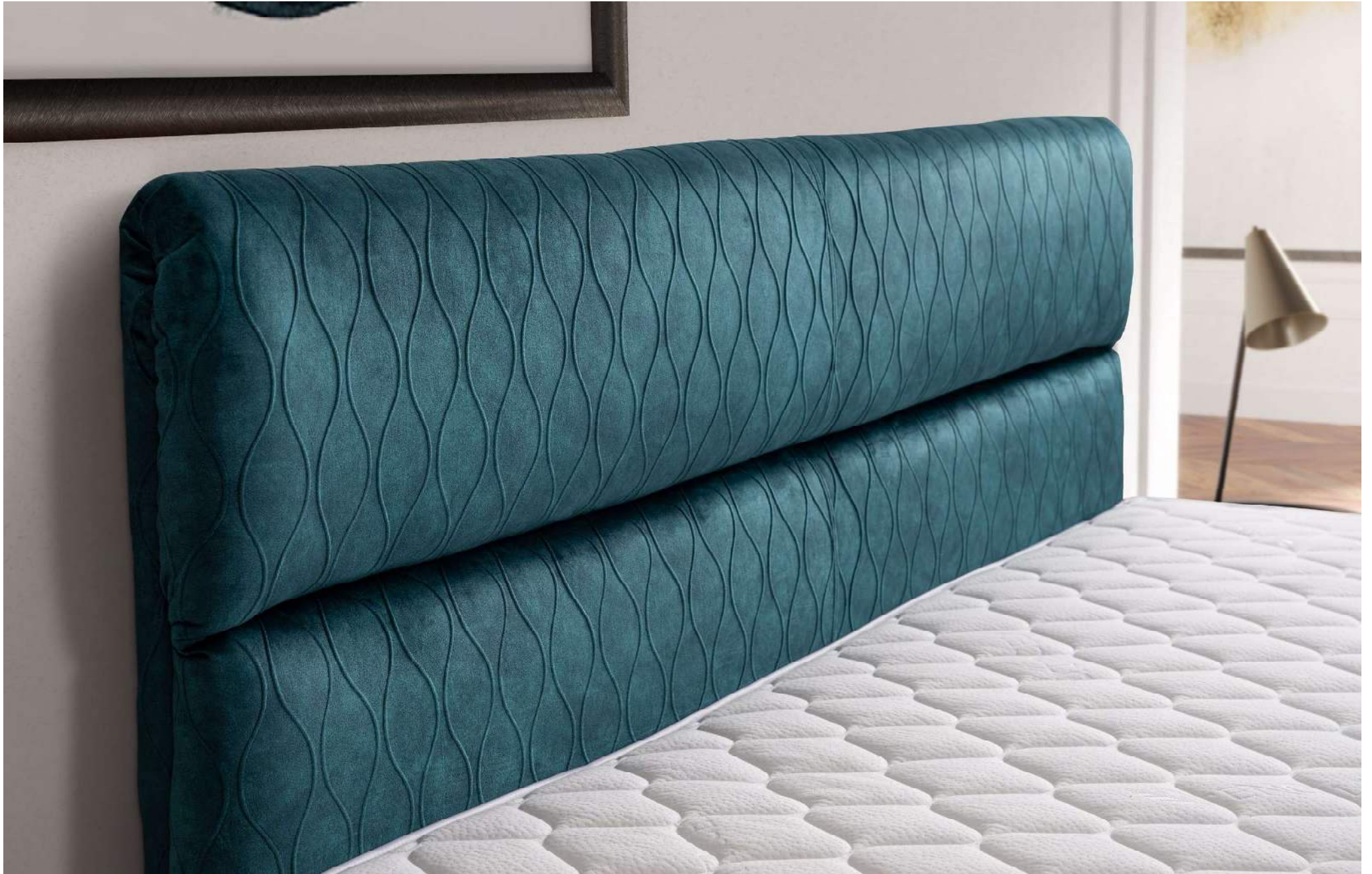
KING | Boxspringbett System | Detail Kopfhaupt D