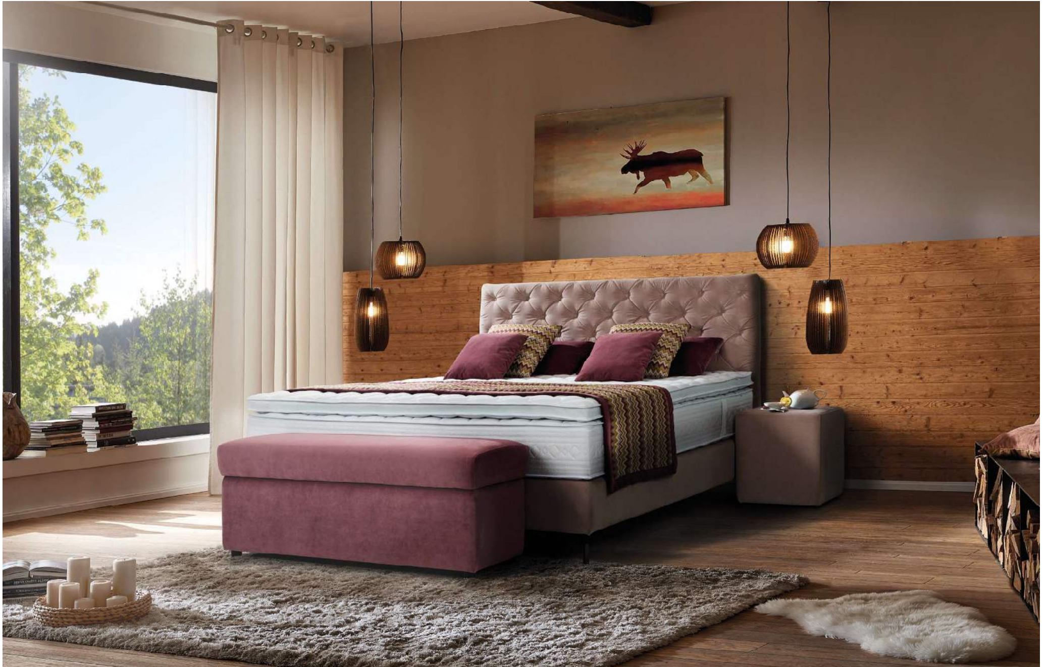
KING | Boxspringbett System | Liegefläche 180 x 200 cm | Kopfhaupt A, Boxspringbox BOX F, Fuß Nr 26 schwarz matt, Matratze mit Partnerbezug, Topper