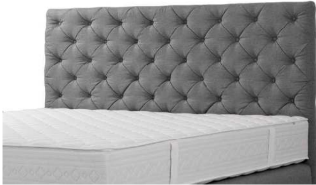
Kopfhaupt A Rautensteppung