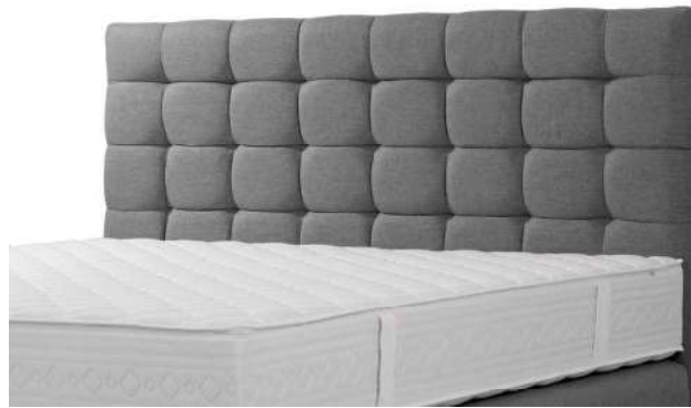
Kopfhaupt B Karosteppung