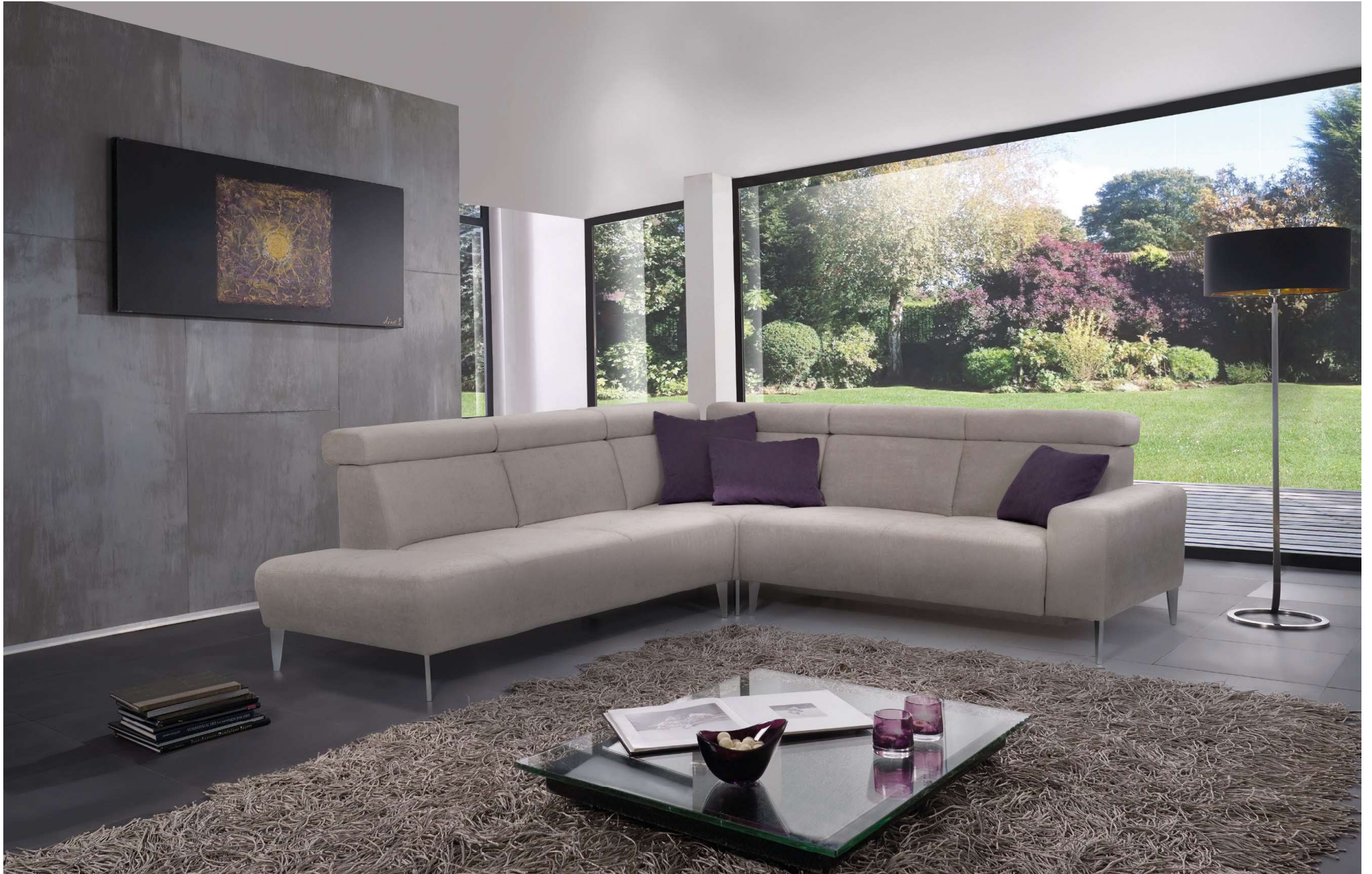
DIVA | AS3-L, EE, S162, AT10-R | Fuss Nr 25 Alu glänzend