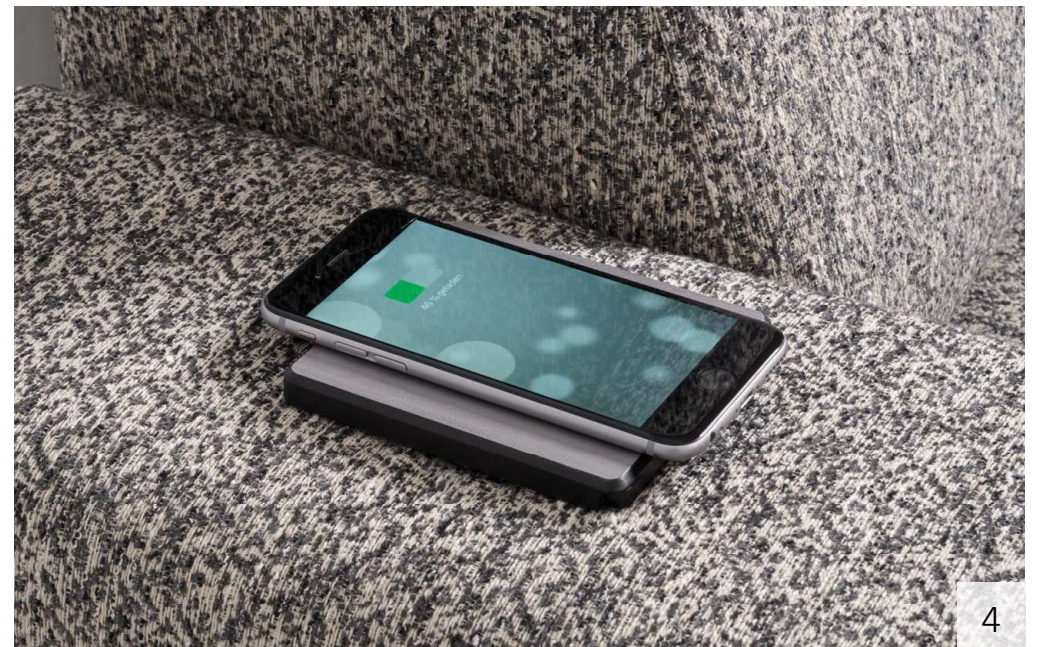
DIVA | 1. elektrische Schlafbank | 2. Infrarot Tiefenwärme (elektrosmogfrei) | 3. Funktionskopfstütze | 4. Powerstation in Longchair Armteil