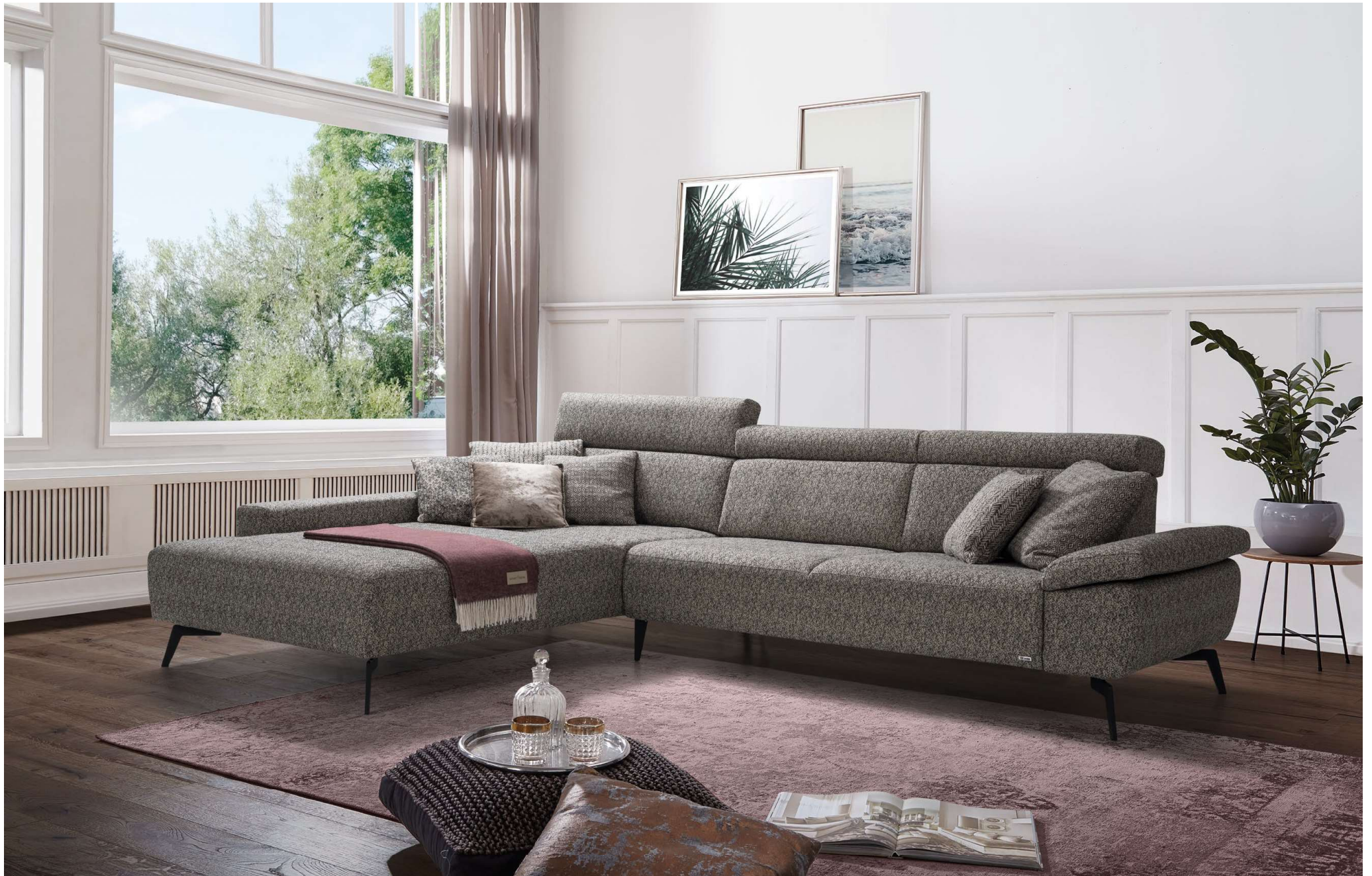
DIVA | CC-L, S16E, AT20-R | Fuss Nr 29 schwarz matt